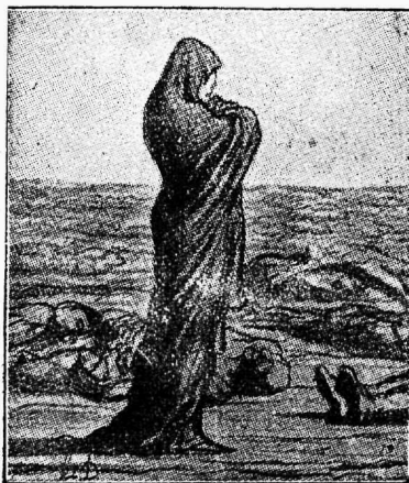
Honoré Daumier: Pisarate orus.

peetakse Riias 22. ja 23. märtsil. Päevakorras on m. s. sotsialistlikkude üliõpilaste ülesanded töölisliikumises, mis ainele on kutsutud refereerima meie liidu esimees sm. N. A n d r e s e n.