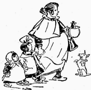
„Ema, kas see vorst kasvab ikka uuesti?“

Ja siit on pärit ta kunstki. Seda proletariaati ta tundis lapsepõlvest saadik, selle elu oli eland temagi. See ei ole veel teadlik, edasitungiv, töölikklass, nagu ta suure ametiõe Käthe Kollwitz'igi joonistustes, see on kannatav ja viletsuses ägav töölikkond, kes vaevalt loodab paranemist oma olukorrale. Zille on näind seda viletsust päevpäevalt, aast-aastalt lohutamatus sünguses, ta on näind selle muresid, ta harvu valgusepilke, viha ja armastust. Ta on näind seda keldritubades, tagahooves ja kõrtses. Kui ta kujutab seda, see kujutus on tükk elu, nii lohutamatu ja inetu, nii lootusetikast ja kaunist kui on elu ise. Sellesse rahvasse Zille uskus, ja tema piltide naerust kui ka nutust paistab, et kunstnik on armastand seda rahvast nõnda kui vahest vähesed on armastand.