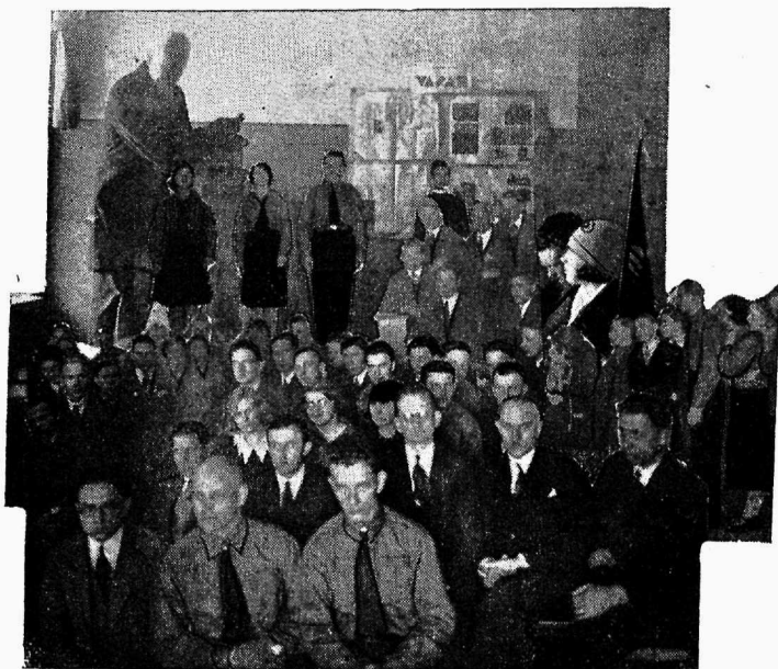
Eesti Noorsotsialistliku Liidu V kongress 29. ja 30. märtsil Tallinnas. Lõikeid kongressist.