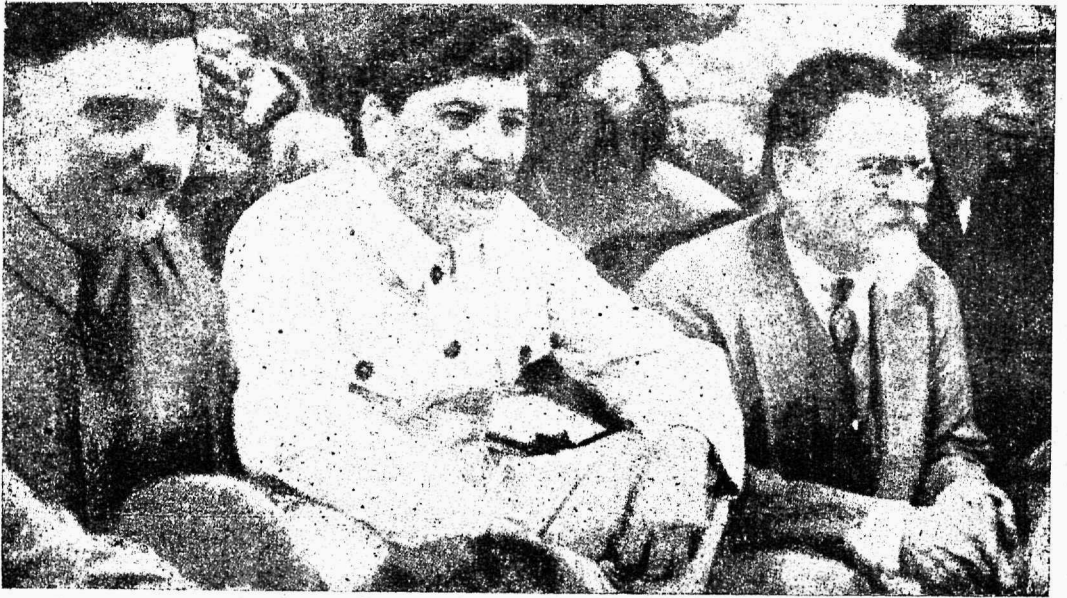
Sm. Woroschilow, Stalin ja Kalinin partei XVI kongressil