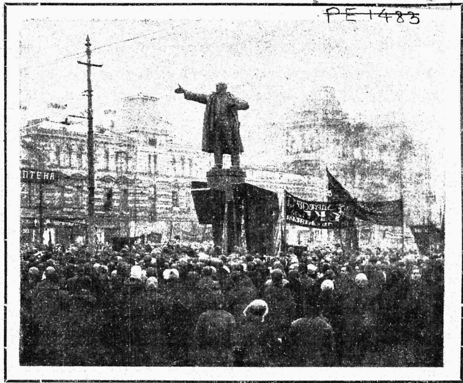
Leenini mälestusesamba avamine Soome waksali ees Leeningraadis 7. novembril 1927.