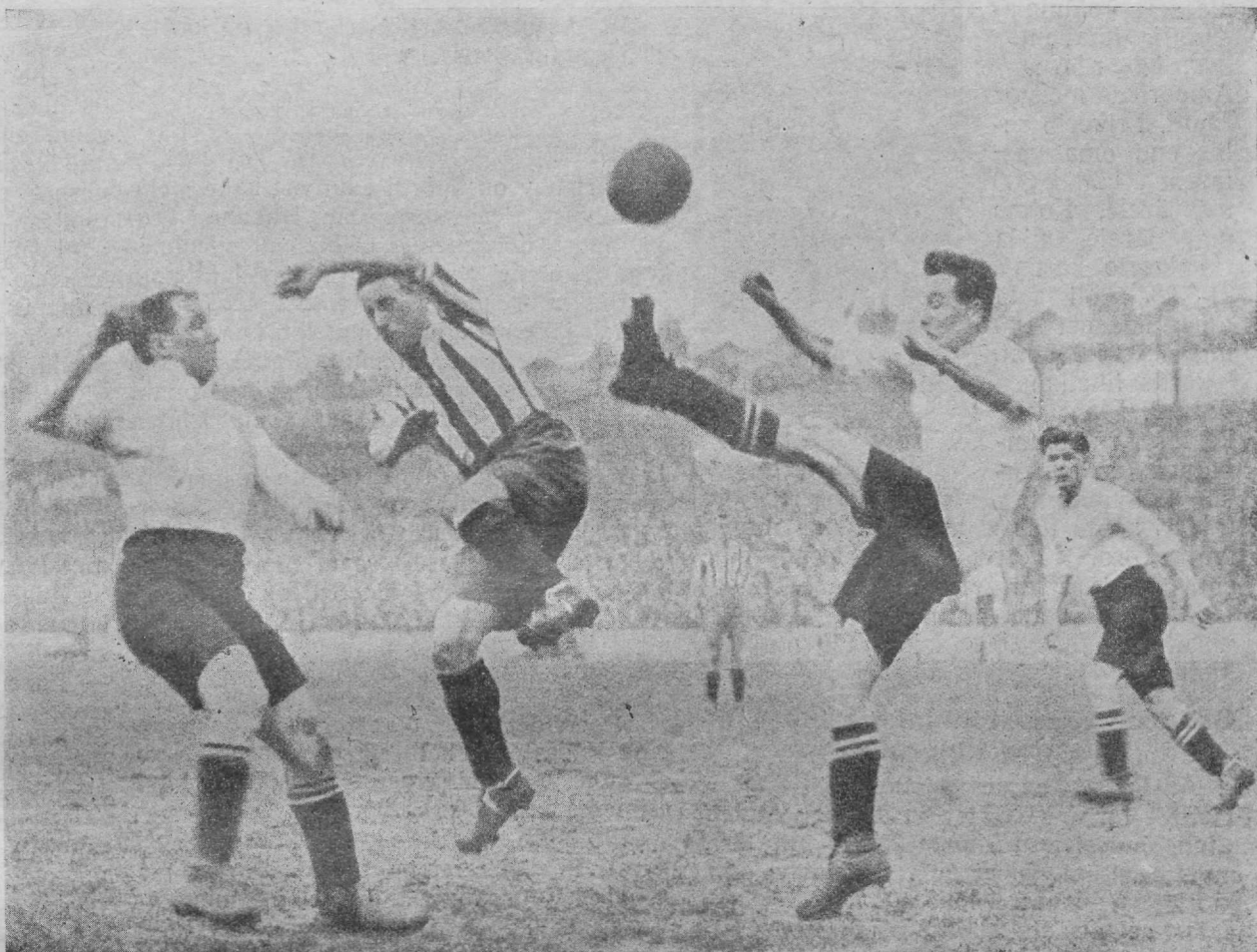
Moment Inglise võistlustelt: Tottenham Hotspuri kaitsja (valges) likvideerib Bolton Wanderersi ajaja läbitungi.

Teine poolfinaali võistlus oli Nottinghamis. Blackburnist tuli 7 erarongi pealtvaa-