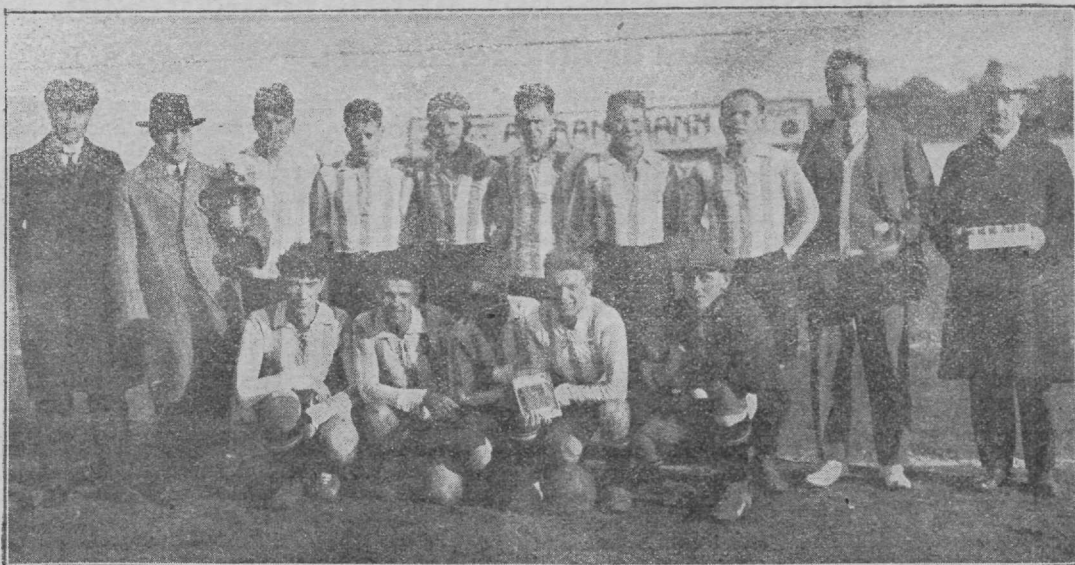
V. S. Sport, viiekordne Eesti meister.

Austrias: Amateure — Sportklub 6:2; Rapid — Vienna 3:2; Simmering — WAC 4:2.