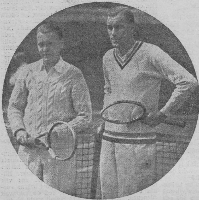
Vincent Richards ja William T. Tilden, kaks suurimat maailma tenniseimestrit.

William Tilden ei ole mitte ainult ilma parim tennismängija, vaid ka väljapaistvam teadlane ja kirjanik oma ala kohta. Ta on seni juba tennise tehnika ja psühholoogia üle 7 eriraamatut kirjutanud. Viimane ja populaarsem tema töö on The art of lawn tennis , mis 5 aasta jooksul seitse trükki läbi läinud. Avaldame siinkohal tutvustamiseks peatüki tema väljapaistvast teosest ja püüame edaspidi seda suuremal määralgi teha, kui meie tennismängijad huvi selle vastu tunnevad.