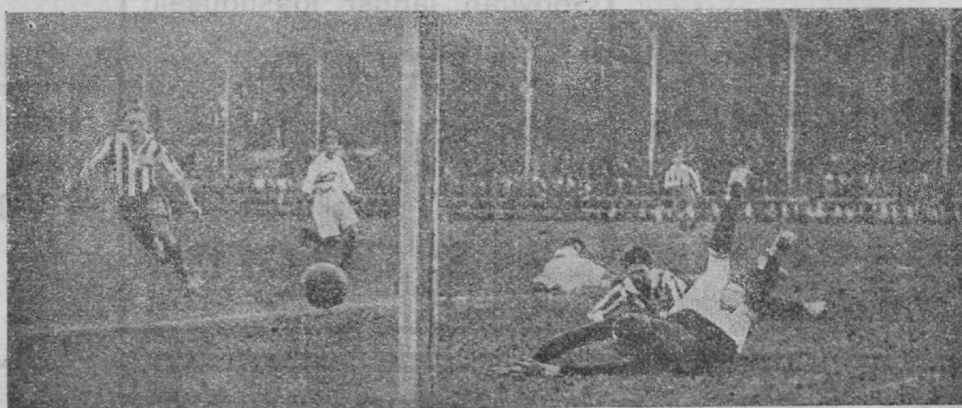
Pariisi olümpia turniiri matshilt Türgi-Tsheho-Slovakkia.