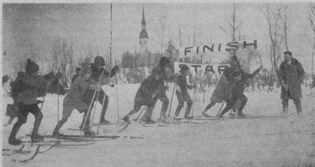
Noorte poiste — „tulevaste suusakuningate“ — start suusajooksule ümber Linnamäe. Starterina näha paremal Toomas Kivi.