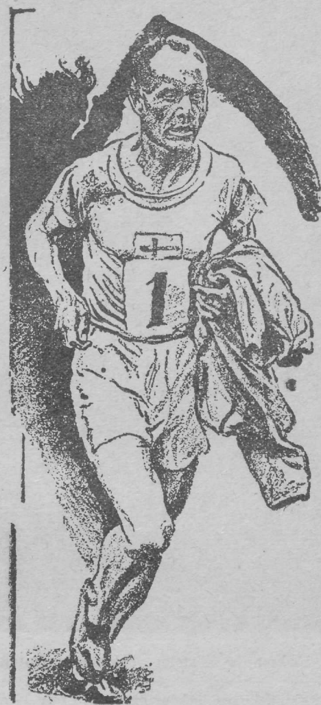
Nurmi, nähtuna Ameerika scharshis. Selja taga ta võitmatu ja lähenev vastane — vanadus.

— Saksa jalgpalliliit on langenud mitme riigi poolt boikoti alla seepärast, et ta ei võimalda nende maade professionaal-meeskondadel Saksa meeskondadega võistelda. Boikoti on kuulutanud välja Austria, Ungari ja Tschehhoslovakkia.