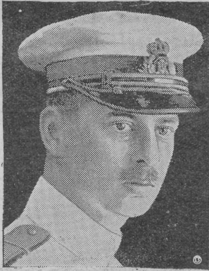
Rumeenia kuningas Carol.

Kuningas loodab saavutada häid tule- musi. Loodab lühendada sõjaväeteenis- tusaega, mida võimaldab noorsoo varaja- ne kehaline kasvatamine. Kuningas laseb ehitada ka rida ujulaid, milleks riik lin- nadele abiraha määrab.