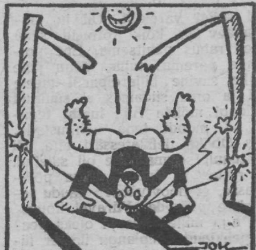
Pigitraat hüppab teivast.