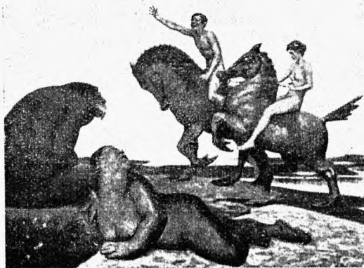
Erich Kügelgen. Sõnum võõrast maailmast.

Noorus kohustab! Julgem üelda — noorus kohustab — ja tegusegem omade töökspidede kohaselt. Noor olla!