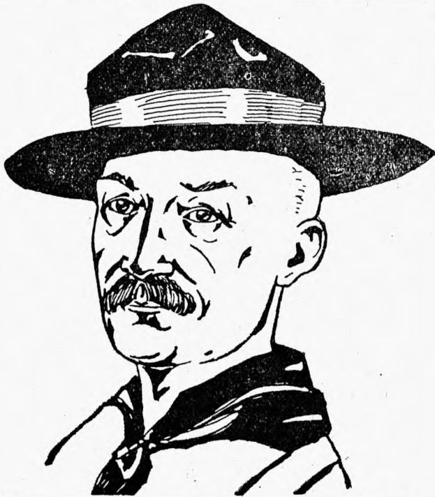
SIR ROBERT BADEN POWELL

sellepärast, et teised on ja võiks uhkustada skoudi vormiga. Sage-dasti juhtusime nägema, kus kaks-kolm skouti kõnniteel üksteise käealt kinni hoides, ehk, suits hambus, koera piitsaga laksutades jalutavat; vastu tulevad vanemad inimesed pidid tahes ehk tahtmata kõnniteelt kõrvale pöörama, et noorte herradele teed anda. Ja enamasti olid niisu-