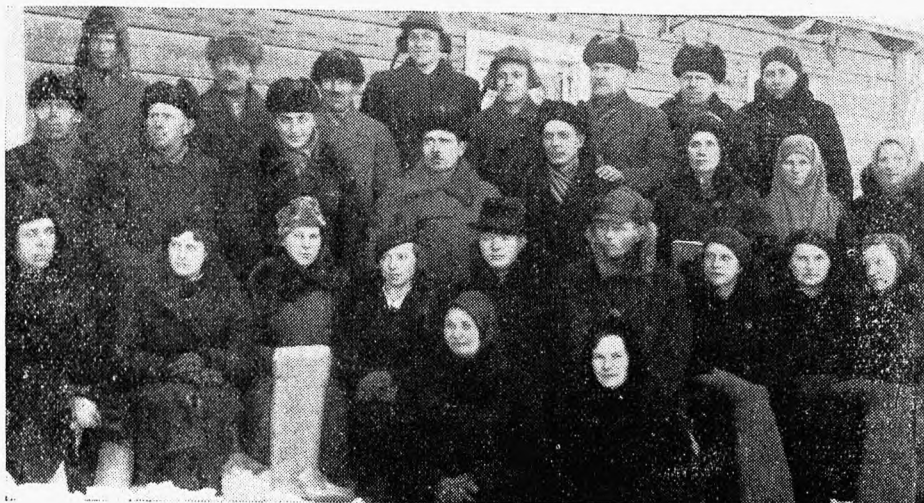
Kanepi väikemaapidajate ühingu poolt korraldatud vildivalmistamise kursusest osavõtjad