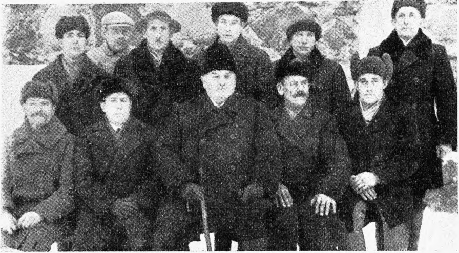
Alatskivi riigimõisa tööliskond. Ees keskel istub mõisavalitseja.

selt remonti: põrandad lagunened, küttekolded vanad ja sooja mittepidajad jne.