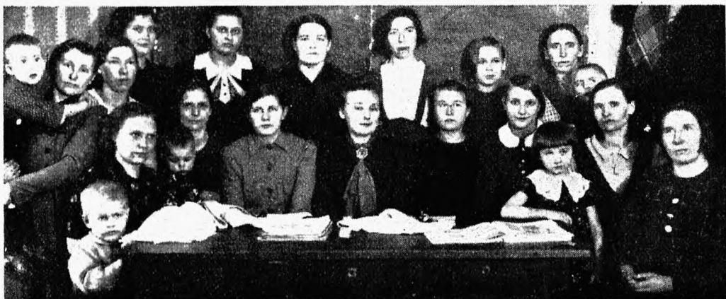
Koja poolt Mooste riigimõisas korraldatud käsitöökursustest osavõtjad.

lõpetati kahenädalised käsitöökursused, mis algasid 5. märtsil, hoogsa lõpukoosviimisega laupäeval, 18. skp. Kursustest võtsid osa peaaegu kõik mõisa töölistnaised, kus samuti kui Jäneda kursustel õpetati kudumist, heegeldamist, tikkimist, juurdelõikamist jne. Kursuste töö kõrval õppisid töölistnaised rahvatantse ja „näitekunsti“, millised kanti ette lõpuõhtul. Tujuküllane tantsu- ja ettekanneteõhtu, kus meeleoloomiseks kaasa aitas kohalik puhkpilliorkester, lõppes alles keskööl.