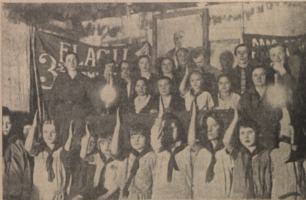
Medodatis (Tomski ringkonnas)

Naistepäewa (8. märtsi 1930. a.) läbiwiimise presiidium. — Ges seisab pioneeride rühm