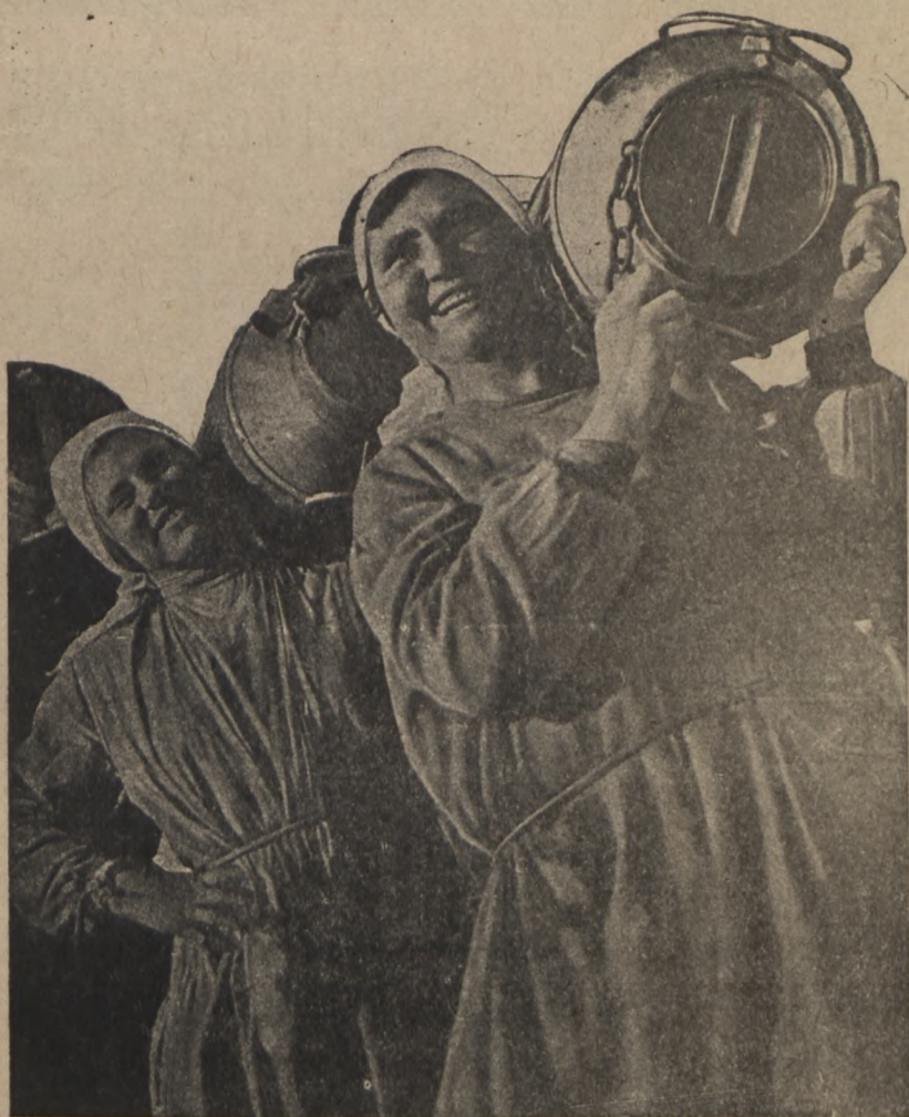
Lüüdsjad = lõõkrühmlased