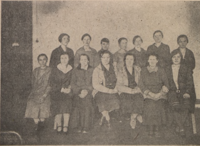
Leningradi eesti kollektiivmajapidamiste naisdelefaatide nõupidamine Leningradis

kollektiiviseerimise ja tema kindlustamise tähtsust, kulaku, kui klassi, likvideerimist, sõjahädaohu ja elu-olulisi küsimusi jne.