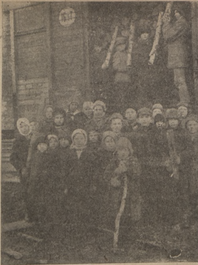
Punase-Struugi cesti foori õpilased puhkepäevil puid laadimas