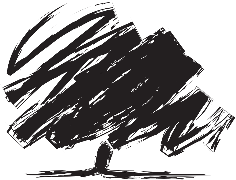
Uus logo esindab erakonna tugevust, vastupidavust, uuenemist ja kasvu David Cameroni juhtimisel.

Teravalt kritiseeriti kongressil leiboristliku valitsuse ebaõnnestunud tervishoiu- ja maksupoliitikat. Varasemast tunduvalt enam pööravad Briti konservatiivid tähelepanu sotsiaalsetele väärtustele ja ühiskonna sidususele - riigi, ühiskonna ja üksikisiku koostööle. Nõnda oli sõnas-