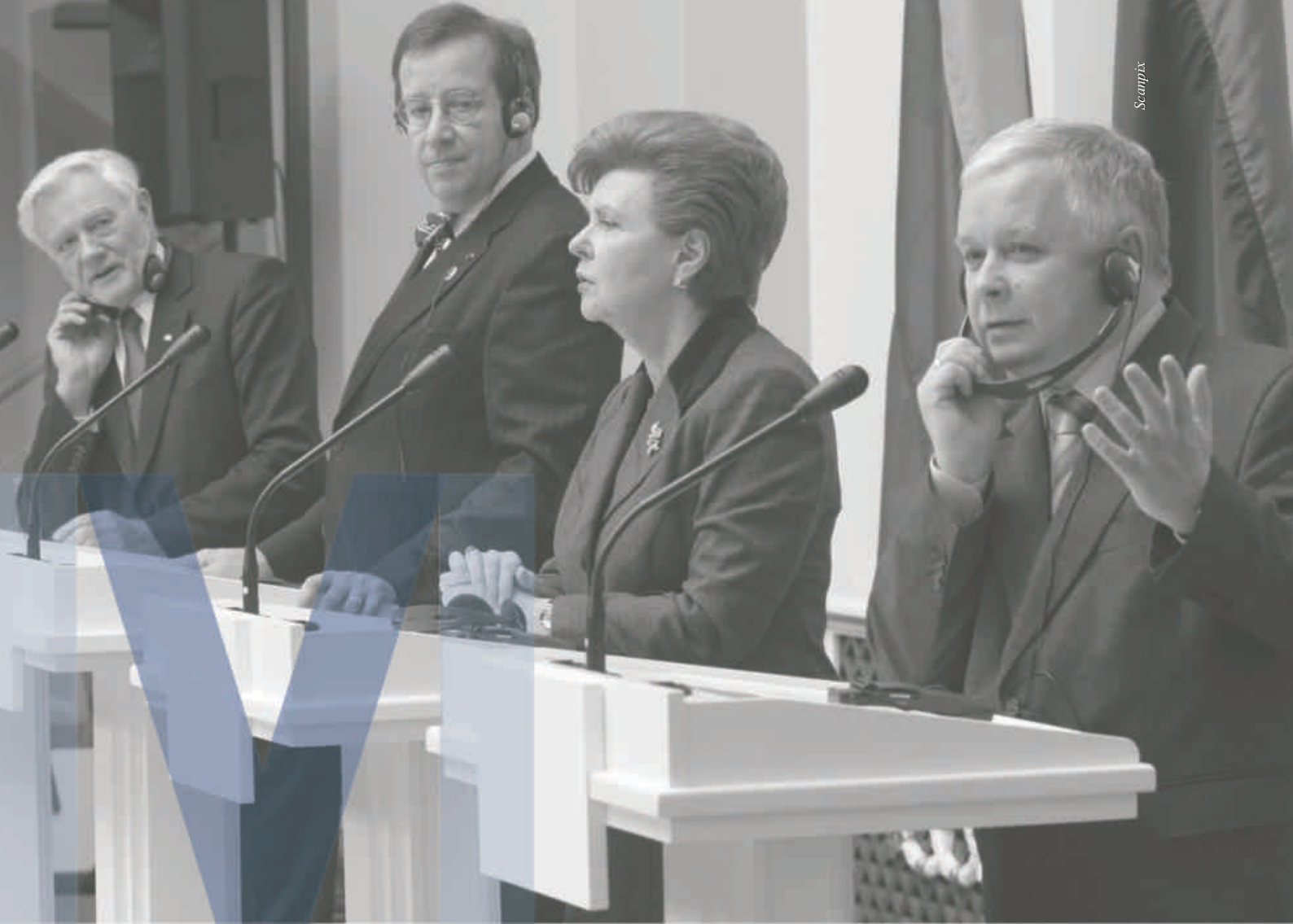
Leedu president Valdas Adamkus, Eesti president Toomas Hendrik Ilves, Läti president Vaira Vīķe-Freiberga ja Poola president Lech Kaczyński kohtumisjärgsel pressikonverentsil Vilniuses 6. novembril 2006.

teine on Venemaa sulgemine lääne investortele. Ühelt poolt jõuline ekspansioon ja teiselt poolt riigikapitalism, ehitamaks üles n-ö liberaalset impeeriumi.