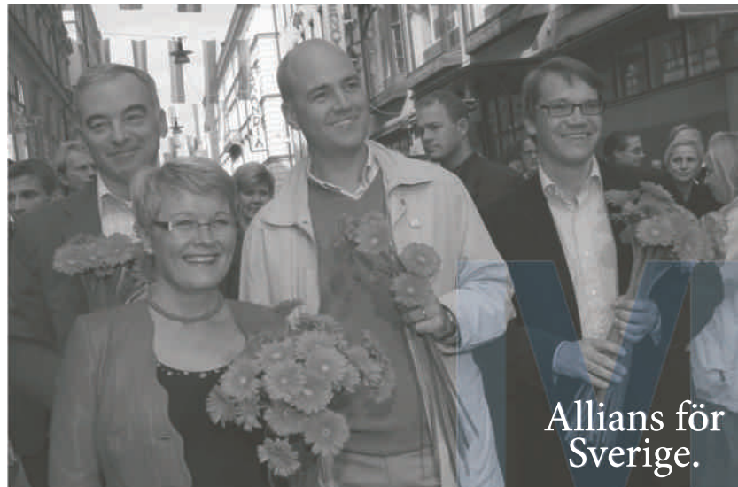
Valimistel võidukaks osutunud paremerakondade esindajad. Paremalt teine praegune peaminister Frederik Reinfeldt.

Kindlasti oli parempoolsete võidul (Moderaadid saavutasid parima tulemuse alates 1928. aastast!) palju põhjust. Silma torkasid nii värske kuvand „Uued Moderaadid“ kui ka allianssi juhtinud 2003. aastal valitud noor liider Frederik Reinfeldt, kuid vaieldamatult peitus peamine edu võti kontrastis konkreetsete ettepanekutega välja tulnud ja koostöötahelise nelikliidu ning väsinud sotsiaaldemokraatliku erakonna vahel, kes väljendas omalt poolt jätkuvat soovimatust läheneda kahele ülejäänud opositsioonierakonnale: vasakpoolsetele ja rohelistele.