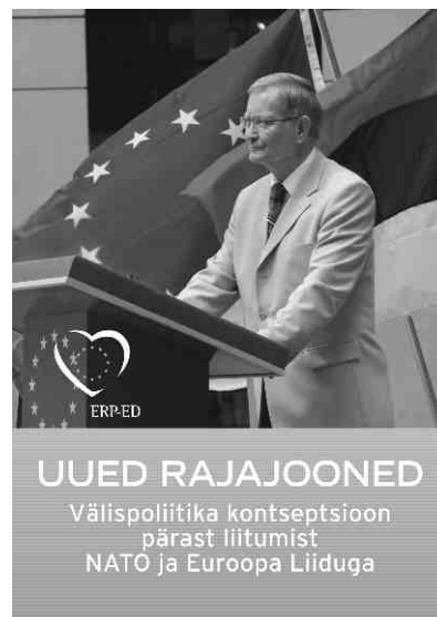
Brošüür „Uued rajajooned“ on saadaval Maailma Vaate toimetuses

Olulise prioriteedina näeme Eestit ELi uue naabrusepoliitika pioneeri rollis. Osalemine rahvusvahelises diplomaatias peab sisaldama kõige vajaliku koostöö kõrval Eesti rolli iseseisva toimijana, mitte kinnistumist teatud jõukeskuste satelliidi seisundisse. Meie ajalooline kogemus, samuti Nõukogude Liidu lagunemisele järgnenud julge ja tulemusrikas areng loovad Eestile hea võimaluse etendada oma rolli niihästi konfliktide lahendamisel kui ka toetada veel nõrga