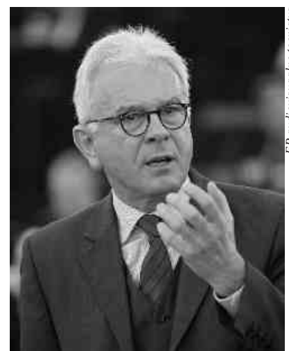
Hans-Gert Pöttering: Kodanikud peavad teadma, kes mille eest Euroopa Liidus vastutab!

Sakslasena olen hästi kursis Läänemere piirkonna võimaluste ja ülesannetega. Ajast, mil enamikust Läänemereäärsetest riikidest on saanud Euroopa Liidu liikmesriigid, on Läänemerele