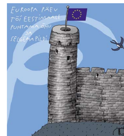
9. mai Euroopa päev Autor Hillar Mets / Eesti Päevaleht, 2007

Esimene sissejuhatav pilt räägib loo eestlase esimesest hommikust „eurooplastena“ – sellest, kas ja kuidas rahva kujutlus liitkuulumisest vastas reaalsusele. Visualiseeritud teemade seas on näiteks suhkrutrahviga seotud vaidlused ja eestlased kui moosisõja rahvas ning meelde on tuletatud ka humoorikat kõverat kurki. „Peatunud on ka kõigil olulisematel poliitilistel sündmustel nagu Eesti-Vene-Euroopa Liidu suhetel, Euroopa Liidu tulevikul ja Lissaboni lepinguga seotud küsimustel,“ selgitas Prööm ning lisas, et karikatuurid kõnelevad ka majandusküsimustest. Näiteks näitab üks viimastest karikatuuridest panganduskriisi saabumist Euroopasse ning mitmete karikatuuride teemaks on senini kõneainet pakkuv euro kasutuselevõtt.