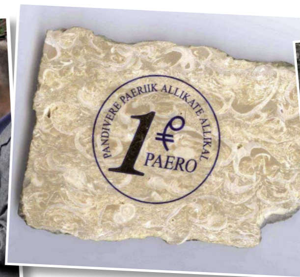
Kohalik rahaühik 1 paero