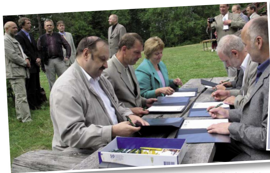
Pandivere koostöölepingu allkirjastamine 27. juunil 2005.

Aasta oli 2005, kui kuus valda Emumäel, Pandivere kõrgustiku kõrgeimal mäel, käed löid ja ühistööd tegema hakkasid. Nüüd on aasta 2009 ja PAIK-i (Pandivere piirkond) kuulub vahepealsete liitumiste tulemusena neli valda – Tamsalu, Laekvere, Väike-Maarja ja Rakke, neile lisaks veel MTÜ-sid ja ettevõtteid. Kokku 34 liiget.