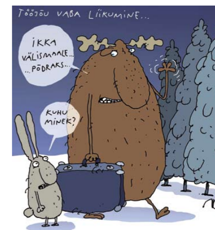
Töötõu vaba liikumine