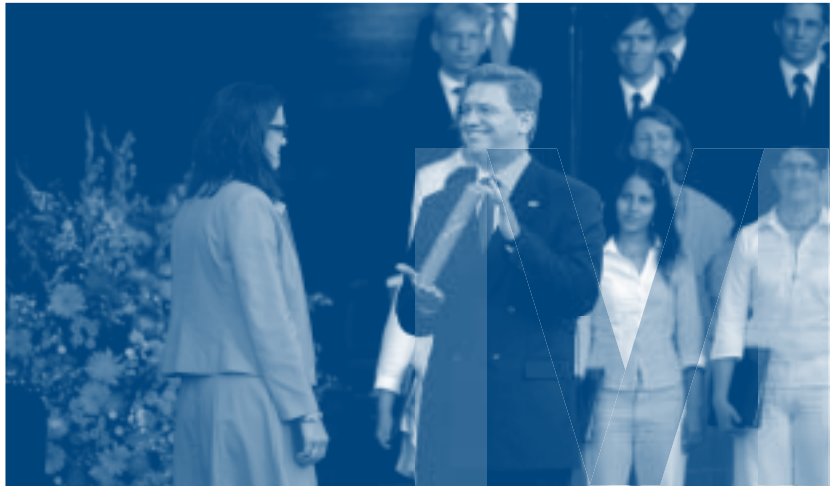
Rootsi Euroopa asjade minister Cecilia Malmström oma Tšehhi ametivenna Stefan Fülega Stockholmis Skanseni vabaõhmuuseumis Euroopa Liidu eesistumise ülevõtmise tseremoonial 1. juulil 2009.

Riigilt, kes kogu seda kirjut koostlust juhtima hakkab, eeldab see lisaks selgete prioriteetide seadmistele ka eri riikide ja piirkondade ees seisvate probleemide mõistmist ning empaatiavõimet lahkkelidesse sattunud liikmesriikide vahel tasakaalustatud lahenduste leidmiseks. Euroopa Liidu õigusaktide rohkust ar-