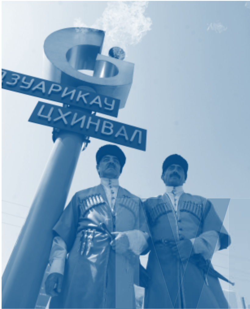
Osseedi rahvariietes mehed Põhja- ja Lõuna-Osseetiat ühendava gaasijuhtme avamisel.

Scampix Kesk-Aasia energiakandjate massiivne jõudmine maailmaturule ning Türgi võimalus seal matti võtta lihtsalt võimalik. Siit siis ka Ankara konstruktiivsus ja koostöö Moskvaga Kaukaasia vastuolude puntras modus vivendi leidmiseks ning energiakandjate liikumist takistavate võimalike kriisikollete likvideerimiseks.