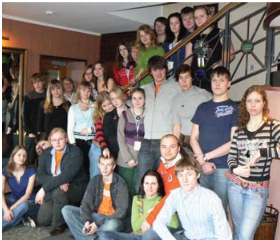
← ENTA korraldatud koolitusel osalenud õpilased on nüüd teadlikud multikultuurilise meeskonnatöö eelistest.

toetudes võib järeldada, et kompleksne ja süsteemne lähenemine karjääriplaneerimisele võib olla üheks efektiivseks mooduliks tutvustamiseks multikultuurilise meeskonnatöö olemust ja selle rakendatavust ning väljundeid Eesti oludes. Praktika näitab, et vastava koolituse saanud õpilased on võimelised seostama näiteks suhtlemisoskuste tähtsust meeskonnatöö õnnestumisega ja nägema ka loogilisi positiivseid seoseid meeskonnaliikmete mitmekesisuse ja produktiivsuse vahel. Teisisõnu, õpilane teadvustab, mida meeskonnatöös osalemine talle pakub ja sellest lähtuvalt oskab sellesse õigesti panustada. Veelgi tähtsam on näha perspektiive realiseerimaks oma