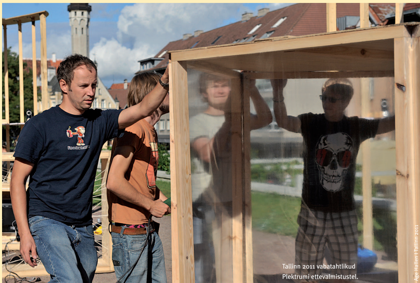
Tallinn 2011 vabatahtlikud Plektrumi ettevalmistustel.