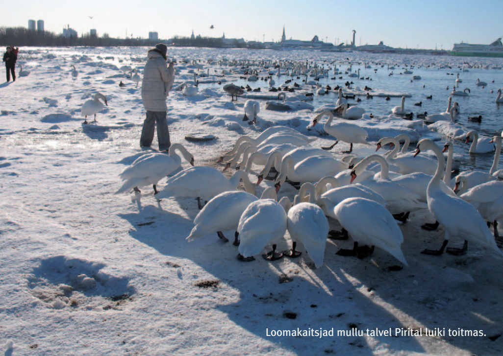
Loomakaitsjad mullu talvel Pirital luiki toitmas.