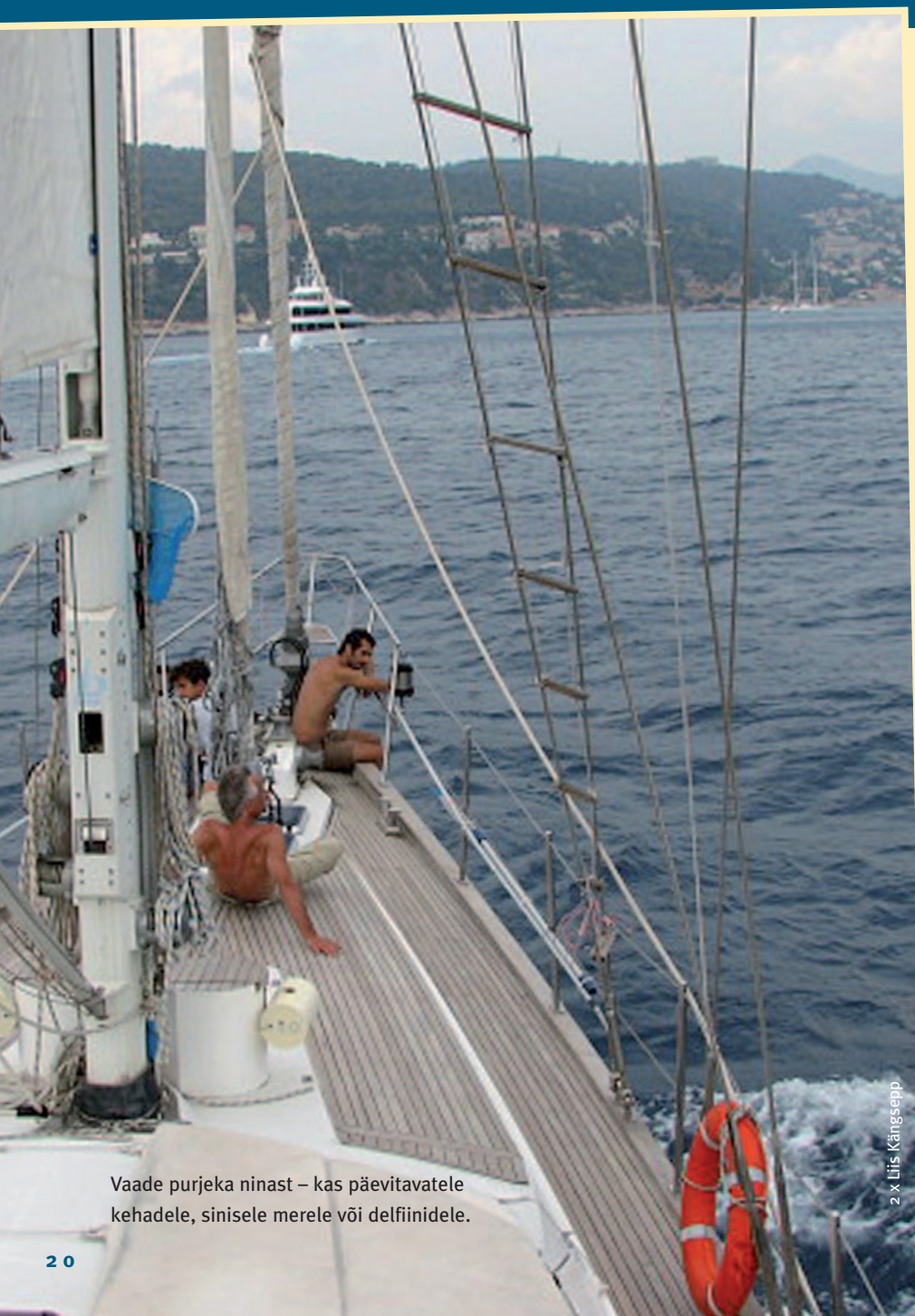
Vaade purjeka ninast – kas päevitavatele kehadele, sinisele merele või delfiinidele.

P uutusin terminiga esmakordselt kokku aastal 2007, kui olin Argentinas Euroopa Noorte abiga tegemas Euroopa vabatahtlikku teenistust, ja sel hetkel vist ei andnud endale aru, et olin ka ise volunturist. Läksin tegema vabatahtlikku tööd, kuna tahtsin näha, kuidas inimesed mujal elavad, tahtsin aidata ja tahtsin õppida uusi keeli. Seega ühendasin reisimise vabatahtliku tööga.