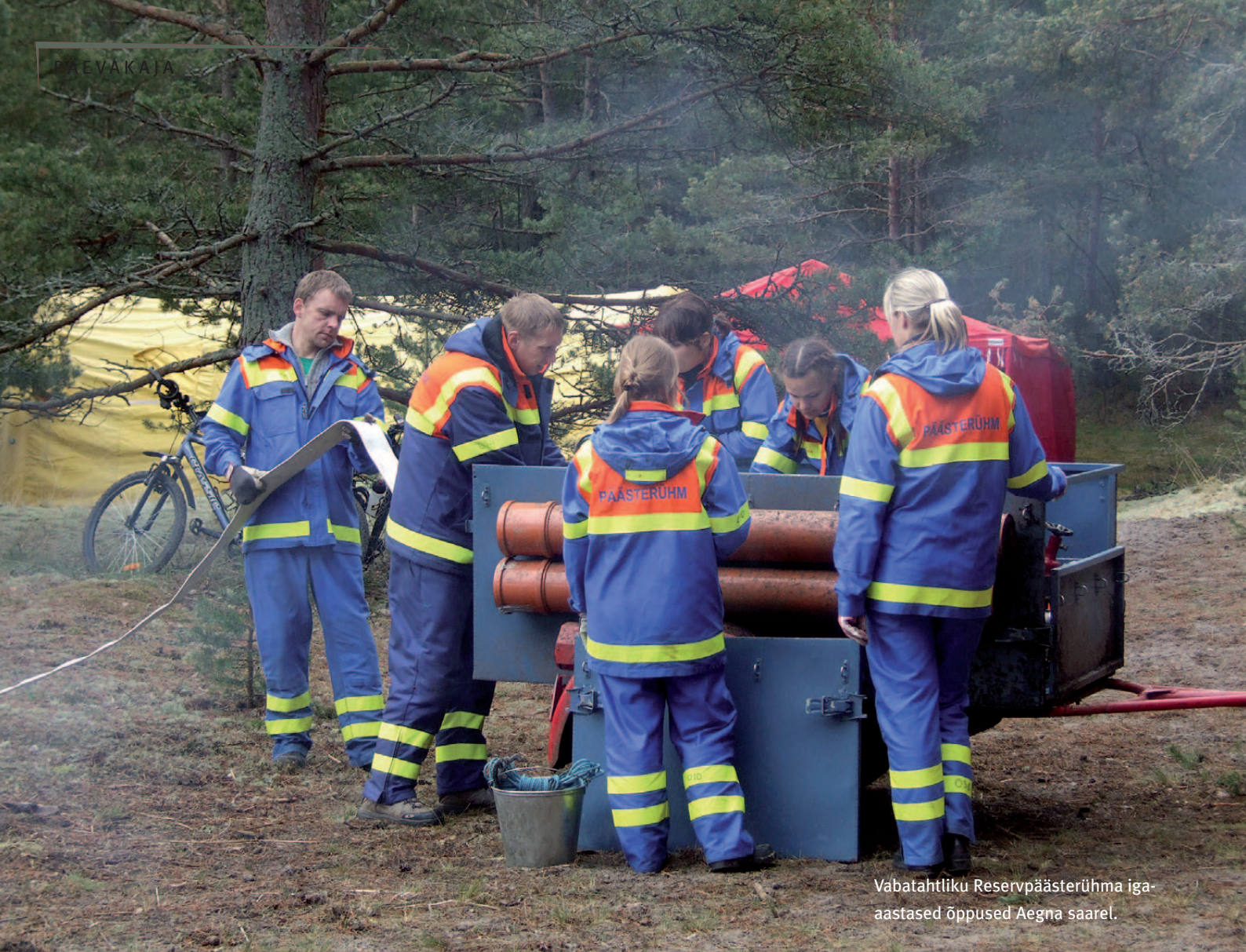
Vabatahtliku Reservpäästerühma iga-aastased õppused Aegna saarel.

mus, kuna teadis, et ma ei proovinud teda õigele teele suunata seetõttu, et see oli mulle töö, mille eest makstakse palka.“