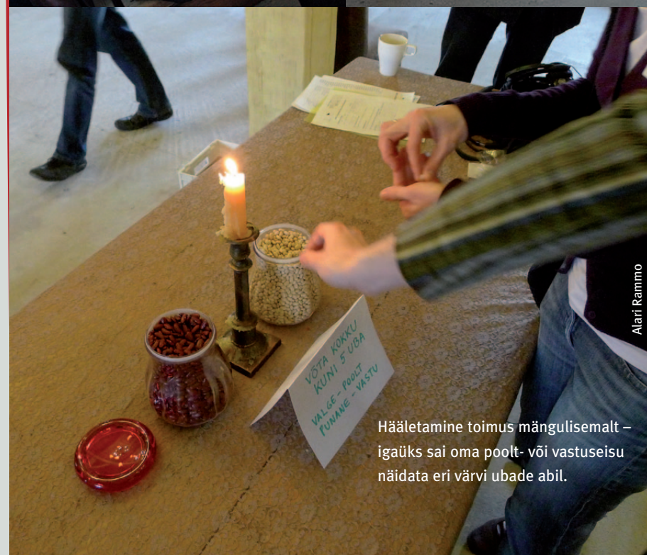
Hääletamine toimus mängulisemalt – igaüks sai oma poolt- või vastuseisu näidata eri värvi ubade abil.