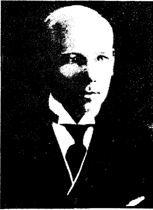
ANTON ÜKSTI 1888 - 1942

halt suure tähtsusega sündmus, kuid käesoleval juhul on Rootsi gümnaasiumi avamine kohalikele rootslastele kahtlemata suurpäevaks. Teatavasti on Eestis kõikidele vähemusrahvustele lubatud oma emakeelne kool ja muud soodustused oma rahvuse alahoidmiseks ja arendamiseks emakeele kultuuri kaudu. Vähemusrahvustele antud kultuurautonomia alusel on seni kõik teised rahvused (sakslased, venelased, juudid) kasutanud neile seadusega antud õigusi ja avanud oma keskkoolid, mis tegutsevad juba aastaid.