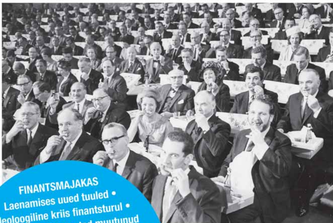
A lunch break during the Institute of Directors annual conference at the Royal Albert Hall, London

FINANTSMAJAKAS Laenamises uued tuuled • Ideoloogiline kriis finantsturul • Ida-Euroopa väljavaated muutunud maailmamajanduses • Euroga liitumine praktilas • Eelarvestamine ja tulemusjuh- timine suures segaduses. • Ettevõtte- pank-investor. Mida õppisime? • Elektrituru avanemine • Riigisisene ja rahvusvaheline maksuplaneer- imine. • Eesti ja maailma- majanduse seis.