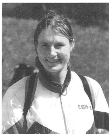
Ruthil ja Sixtenil on nendelt võistlustelt kaks medalit koju viia.

Selle küsitluse tulemuste põhjal tegi IOFi kaardikomisjon otsuse viia rahvusvahelised lühirajavõistlused läbi kaardil mõõtkavaga 1:10000. Kaart ise peab vastama orienteerumisjooksu kaardi standardile. (Björn Persson, Orienteering World, 1994, 6).