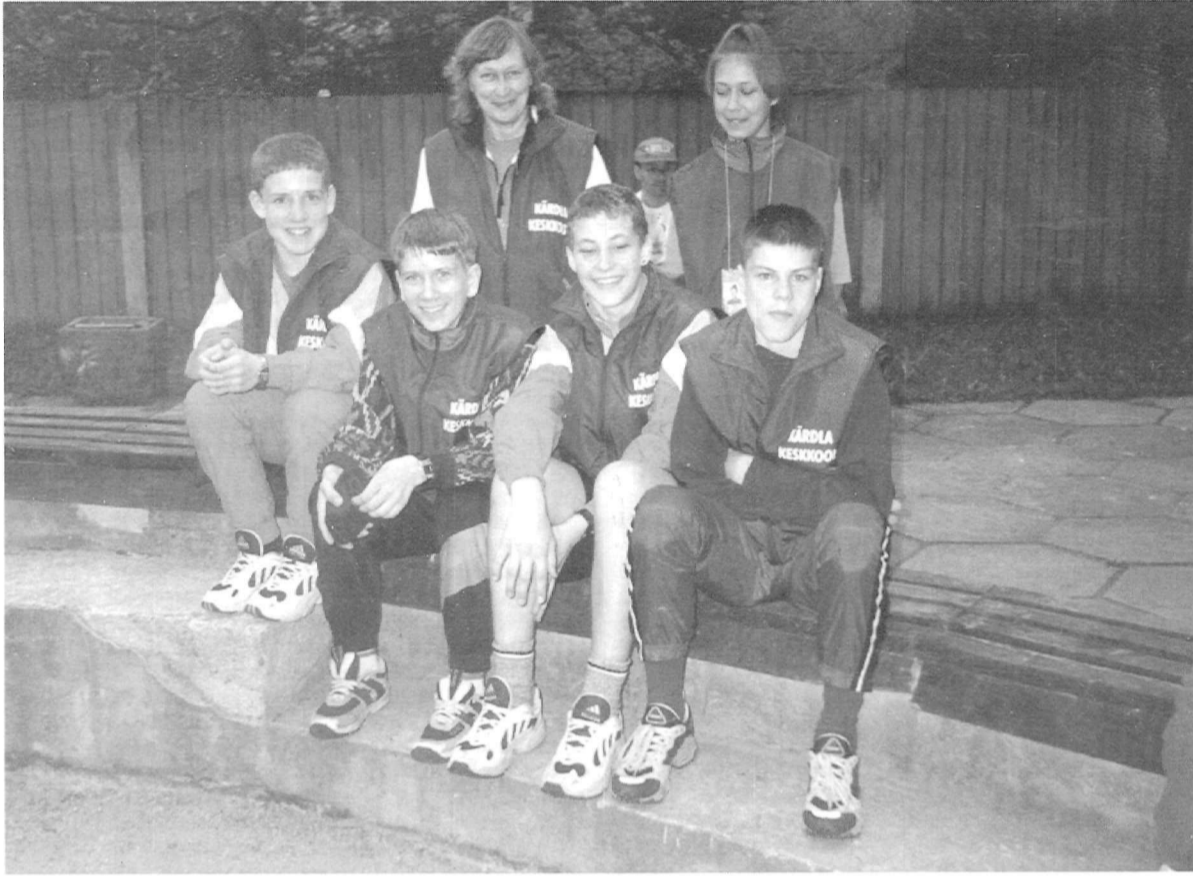
Võidukas Kärddla Keskkooli võistkond