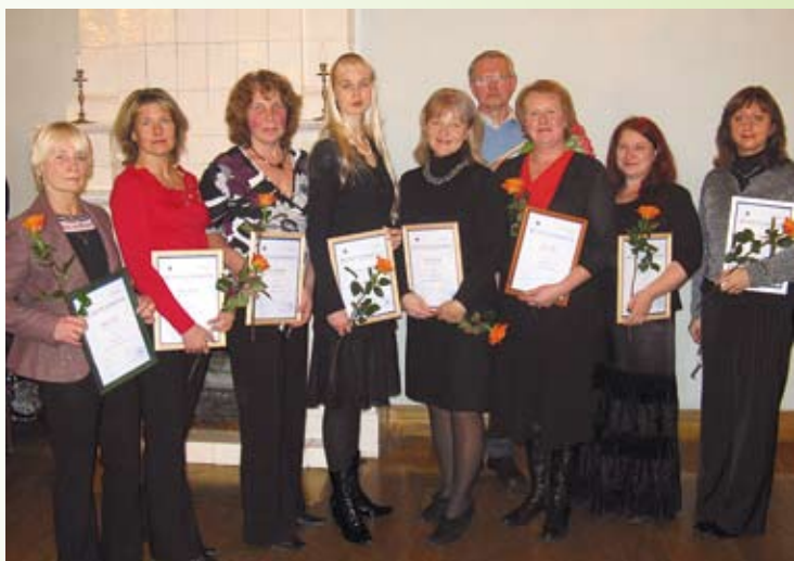
Andragoogi kutsega koolitajaid on iga aastaga rohkem. Sügis 2009