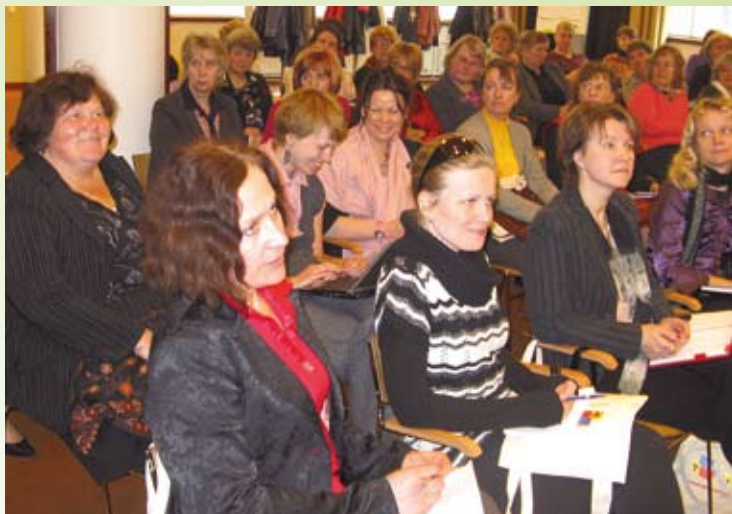
Teabepäev-koolitus Tallinna, Harjumaa, Lääne-Virumaa ja Läänemaa TÖN-i võrgustiku liikmetele. Kevad 2010