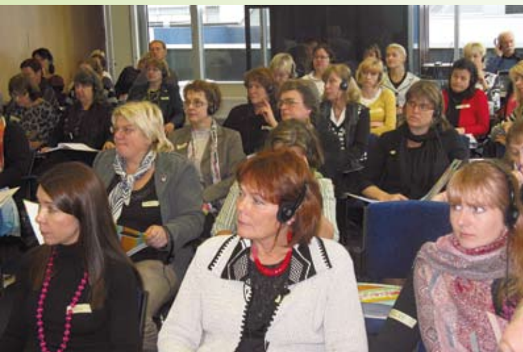
Täiskasvanute gümnaasiumide ja kutsekoolide õpetajad tutvusid Suurbritannia kogemustega. Sügis 2010