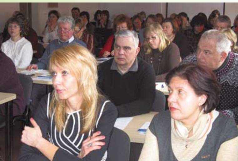
Andragoogi kutse propageerimise seminar Rakveres. Kevad 2010