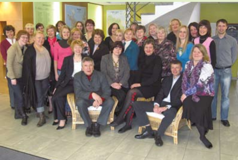
Täiskasvanud õppija nädala (TÖN) koordinaatorite nõupidamine. Kevad 2010