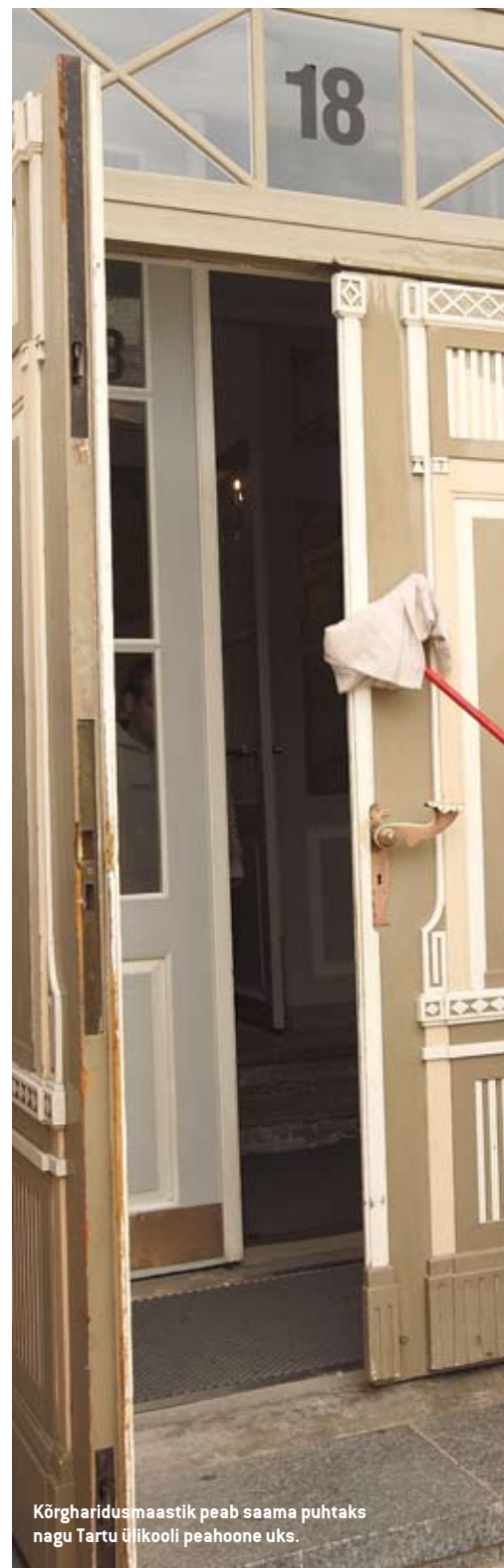
Kõrgharidusmaastik peab saama puhtaks nagu Tartu ülikooli peahoone uks.

Üleminekuhindamise kaudu võib kõrgkool saada kas tähtajatu või tähtajalise õiguse õpet läbi viia. Tähtajatu otsus tähendab seda, et komisjoni hinnangul on õppekava kvaliteet seitsmeks aastaks garanteeritud. Tähtajalise otsuse korral peab kõrgkool komisjoni esiletoodud probleemidele lahendused leidma ja kolme järgneva aasta jooksul uuesti hindamisele minema. Seejuures on oluline teada, et eri kõrgkoolides on probleemide hulk ja kaal väga erinev.