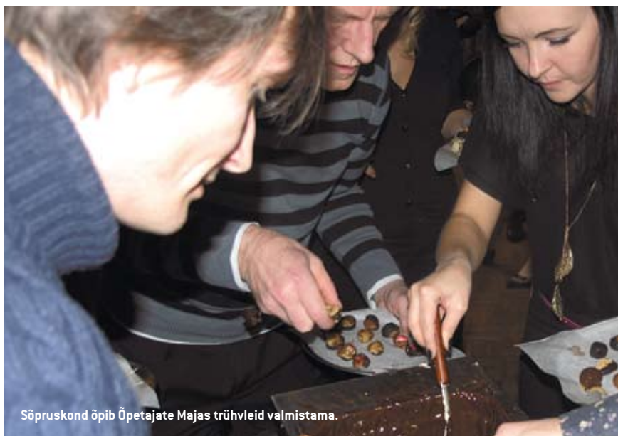
Sõpruskond õpib Õpetajate Majas trühvleid valmistama.