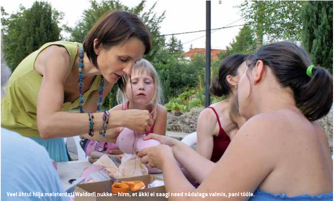
Veel õhtul hilja meisterdati Waldorfi nukke – hirm, et äkki ei saagi need nädalaga valmis, pani tööle.

rialoeng, kus õpetati mängulist lapsekasvatust. Mittetulundusühing Hand in Hand ( www.handinhandparenting.org ) on üle 20 aasta toetanud lapsevanemaid kasvatusmeetodiga, mis ei tugine karistuse ega tasu süsteemile, vaid filosoofiale, mille keskmeks on laste kaasündinud soov armastada ja olla armastatud. Selle aluseks on lapse ja vanema suhe. Mida tugevam see on, seda lihtsam on lahendada probleeme, lastekasvatamisest saab lõbusam ettevõtmine ning lapse vaim on vaba, et areneda. Olen õpitud nüüd juba nädalapäevad praktikasse rakendanud ja meie peres see tõesti töötab.