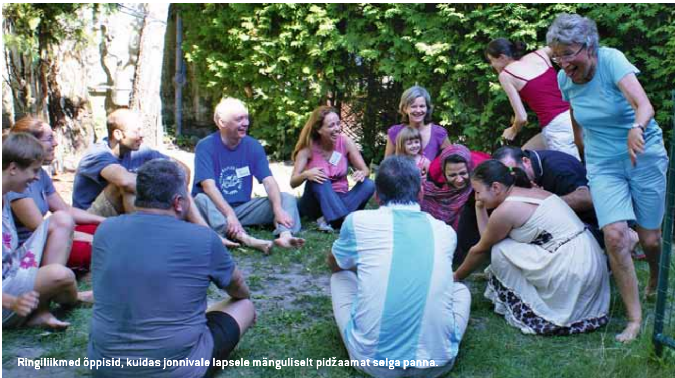
Ringiliikmed õppisid, kuidas jonnivale lapsele mänguliselt pidžaamat selga panna.

vamus, et rattasõiduuskuse kohta uuriti põhjusel, et meid väikesele ringsõidule viia, lükati kohe ümber. Selgus, et need saavad meie igapäevasteks sõiduvahenditeks – pansionaadist Waldorfi lasteaeda ja tagasi. Esimene sõit kolonnis, lõõskava päikese all, tihedas liiklusvoolus võttis üle poole tunni. Lapsed olid janused, higised ja kärsitud, võõrad rattad tundusid ebamugavad, vanemad lausuisid mõttes palveid, et see Kolgata tee kord lõppeks.