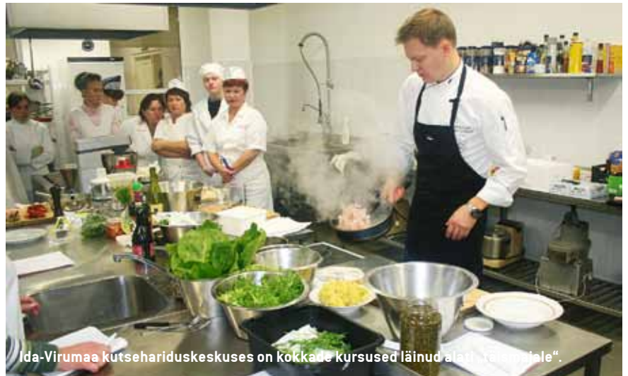
Ida-Virumaa kutsehariduskeskuses on kokkade kursused läinud alati rahvasalale.

Kui algul võisid kursustel osaleda vaid töötavad täiskasvanud ja n-ö kodus olijad (noored emad, pensionärid jt), siis nüüd