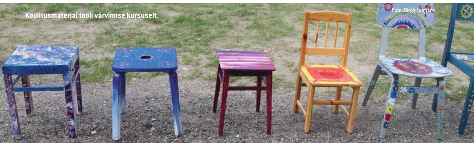
Koolitusmaterjal tooli värvimise kursuselt.

Nooruse Majas toimunu on üks osa nelja aasta pikkusest programmist, mis kestab kuni 2012. aastani. Neljaks aastaks on eraldatud 60 miljonit krooni. Koolituslaata rahastavad Euroopa Sotsiaalfond ja Eesti riik programmi „Täiskasvanute koolitus vabahariduslikes koolituskeskustes” kaudu.