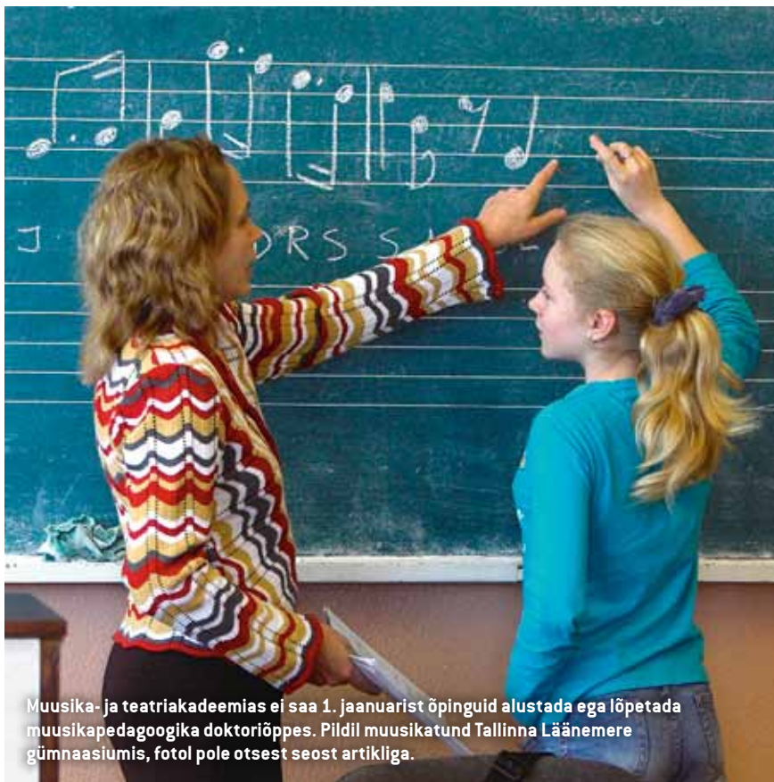
Muusika- ja teatriakadeemias ei saa 1. jaanuarist õpinguid alustada ega lõpetada muusikapedagoogika doktoriõppes. Pildil muusikatund Tallinna Läänemere gümnaasiumis, fotol pole otsest seost artikliga.

Ekspertkomisjonide negatiivsete hinnangute põhjused on olnud erinevad, sest hinnang sõltub ennekõike õppekava spetsiifikast. Muu hulgas on ette heidetud korraliste õppejõudude ja teadustöötajate vähesust ja nende kvalifikatsiooni mittesobivust õppekavade eripäraga. Samuti vähest teadustööd, õppekavade mittevastavust kutsestandarditele ning eesmärkide ja õpiväljundite omavahelist vastuolu.