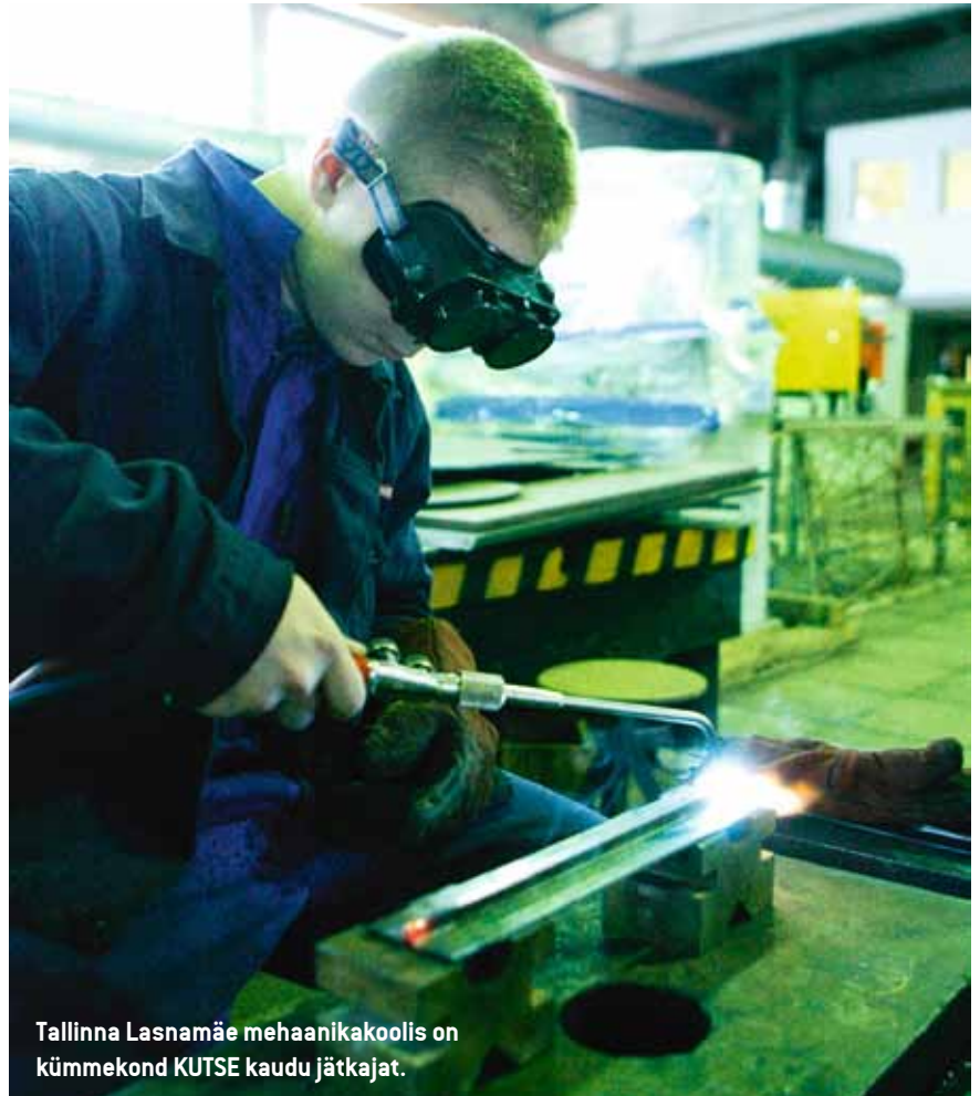
Tallinna Lasnamäe mehaanikakoolis on kümme kütse kaudu jätkajat.

KUTSE programmi kriteeriumide leevendamise soovitakse innustada vanemaegalisi küpseid inimesi kutseharidust omandama. Siinjuures ei ole oluline, kas neil on varasemast taskus mõne kutse-