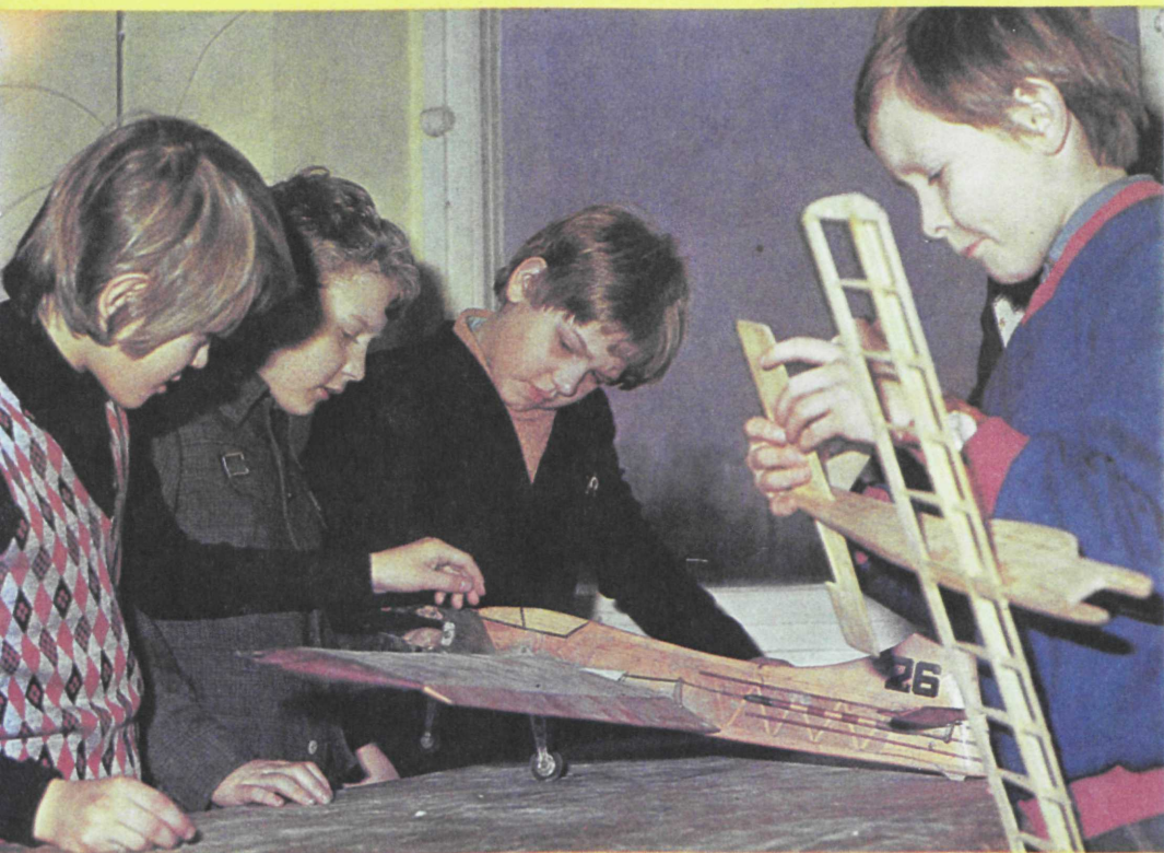
Tehnilise mudelleerimise ringis

POISTELE pakub põnevust konstrueerimisring. Õhinaga koostatakse uute mudelide jooniseid, proovitakse käte osavust ja kiirust ning täpsust. Hiljem läheb kõiki neid teadmisi ja oskusi vaja. Siis kui poistest saavad radio- või automotoklubi liikmed või hakkavad nad tehnilise mudelleerimise ringis mudeleid meisterdama.