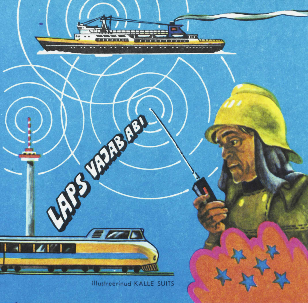
Illustreerinud KALLE SUITS

Esikaanel SILVI VÄLJALI joonistus «Ära puutul!»