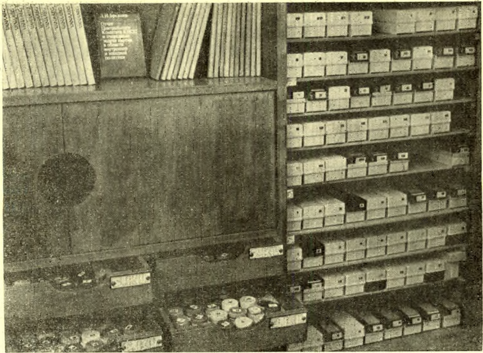
Tallinna 34. 8-kl. kooli ajalookabinetis on rikkalik diapositiivide ja diafilmide valik.