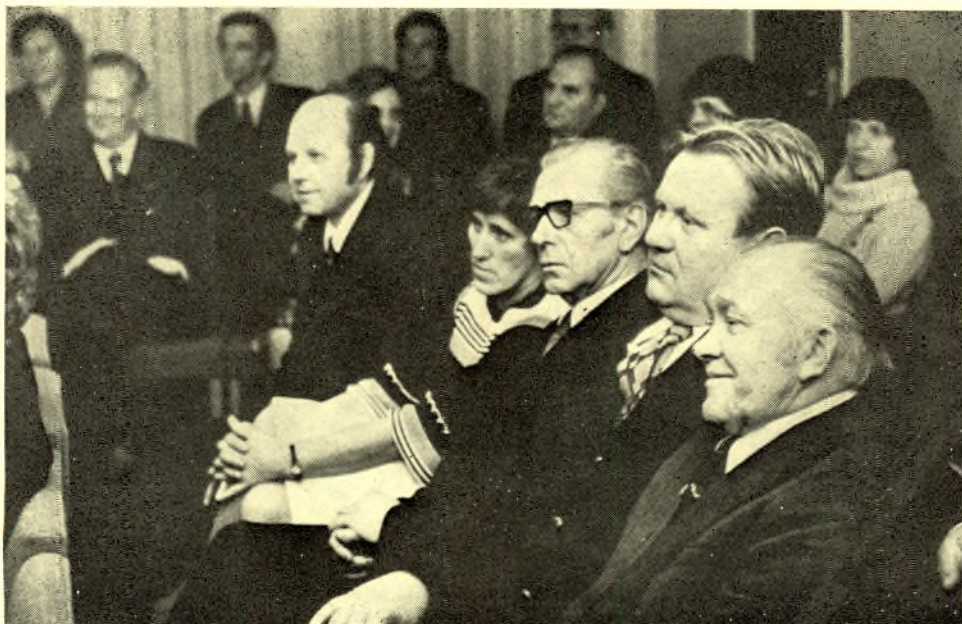
▲ Revolutsiooni-, lahingu- ja töökuulsuse lippude juures pildistatud haridustöö eesindlasi vastuvõtul Haridusministeeriumis.