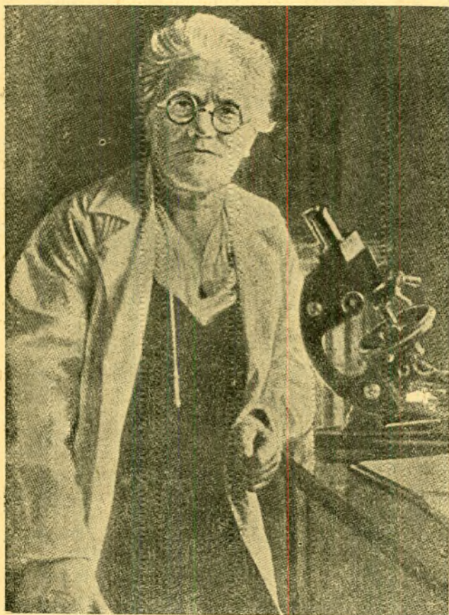
Prof. O. B. Lepešinskaja.

Oma töös „Marksismist keeleteaduses“ märgib seltsimees Stalin, et „... mingisugune teadus ei saa areneda ja edeneda ilma arvamuste võitluseta, kriitikavabaduseta“. Seltsimees Stalin näitab kätte nõu-