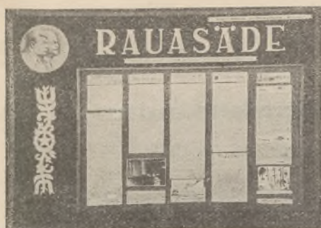
Tallinna 21. Keskkooli vanemate klasside (8.—11. kl.) seinaleht