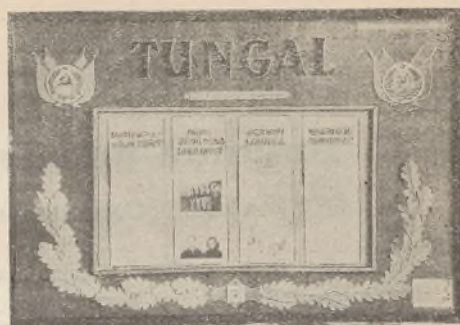
Tallinna Õpetajate Instituudi loodusteaduse-geograafia osakonna III—IV kursuse seinaleht