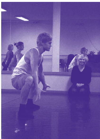
Viljandi kultuuriakadeemia kompositsioonitunnis