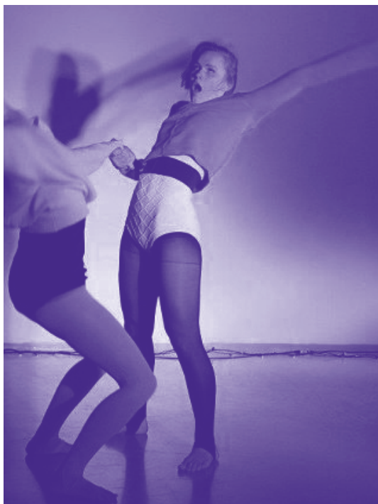
Novembri Tantsu Festival

Niisiis, ärge vedage alt ja tutvuge meie tantsufestivalide fantastiliselt rikkaliku valikuga ajakirja lõpus. ●