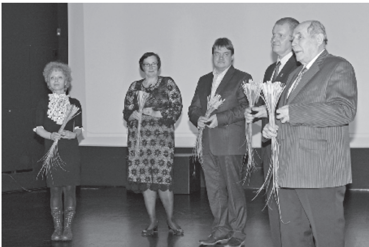
EALi 2012. aasta teenetemedalite saajad.