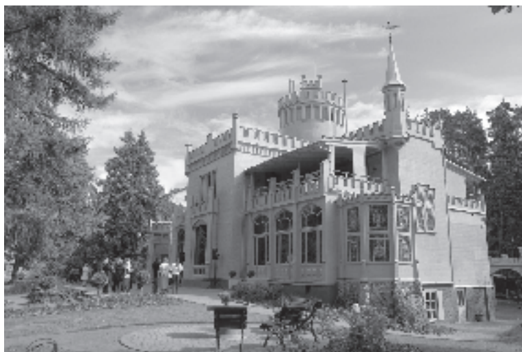
Kristaps Morbergi suvemaja ja botaanikaaed Jūrmalas.