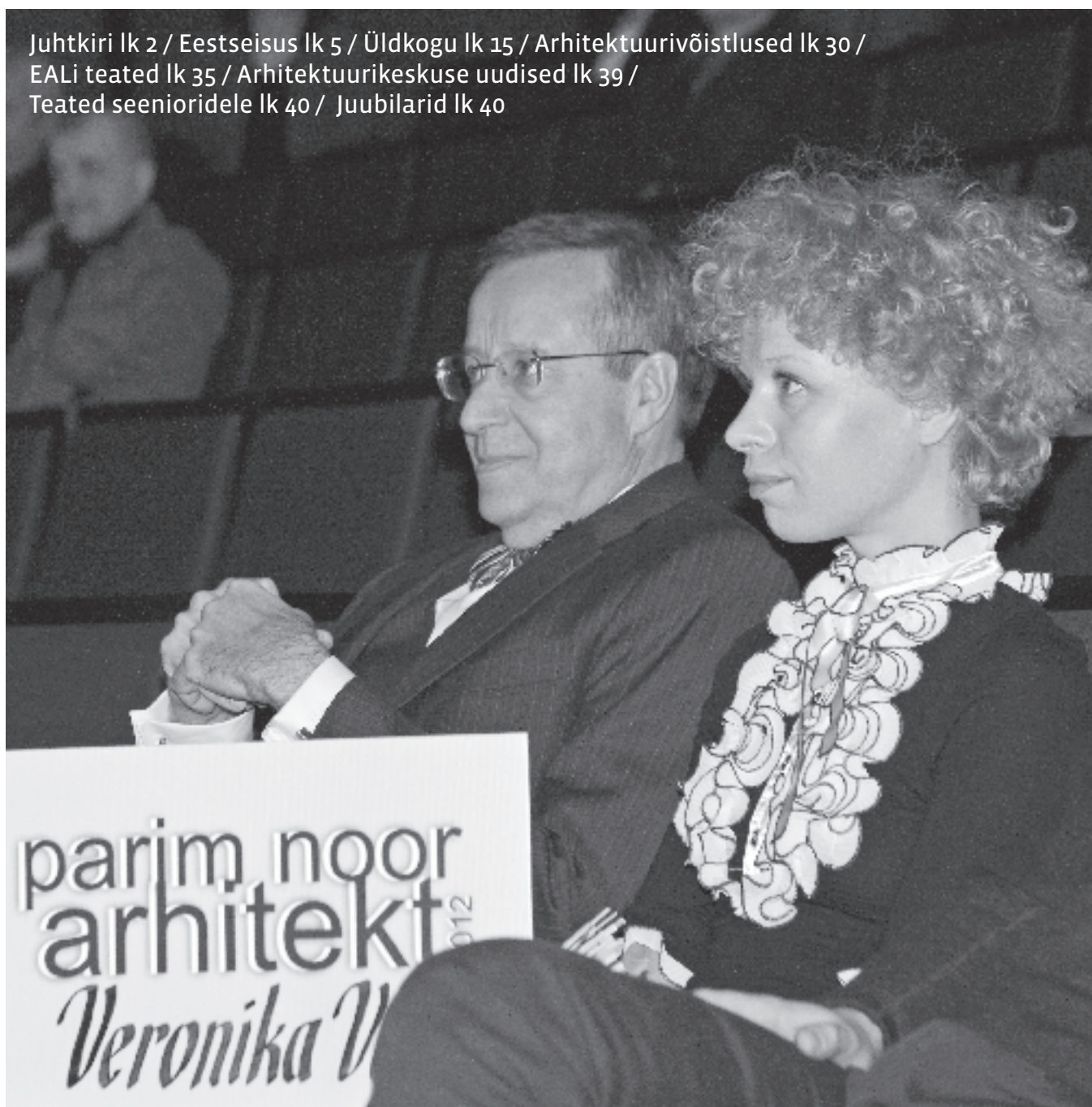
2012. aasta noore arhitekti preemia laureaat Veronika Valk koos president Toomas Hendrik Ilvesega.

Juhtkiri lk 2 / Eestseisus lk 5 / Üldkogu lk 15 / Arhitektuurivõistlused lk 30 / EALi teated lk 35 / Arhitektuurikeskuse uudised lk 39 / Teated senioridele lk 40 / Juubilarid lk 40