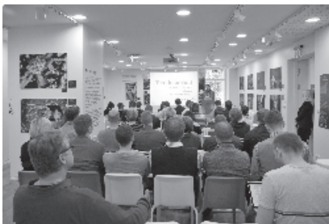
Arhitektuuritrampliini infopäev Eesti Loodusmuuseumis.

10.–14. detsembrini toimus Rakvere Reaalgümnaasiumis, 4.–8. veebruarini Jõhvi Gümnaasiumis ja 4.–8. märtsini Kadrina Keskkoolis EAK arhitektuuri huvikooli näitus. Samal ajal toimusid näidistunnid ja arhitektuuriteemalised töötoad lastele ja noortele. EAK arhitektuuri huvikool ( www.arhitektuurikool.ee ) on 9- kuni 19-aastastele lastele ja noortele mõeldud töötubade sari, kus õpitakse mõistma ruumilise maailma eri- ja seaduspärasid.