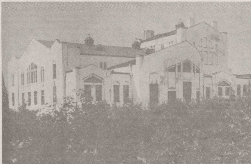
◆1911. a. avatud „Endla“ Seltsi hoone