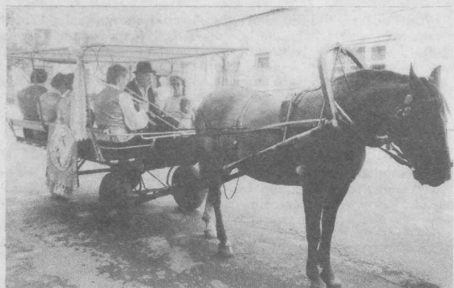
♦ VANAMUUSIKA VANAL VIISIL