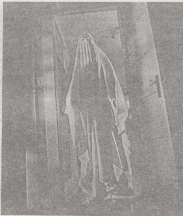
John Carpenteri filmi "Halloween" (1978) elektrooniline heliriba on jäänud selle ala klassikaliseks eeskujuks.