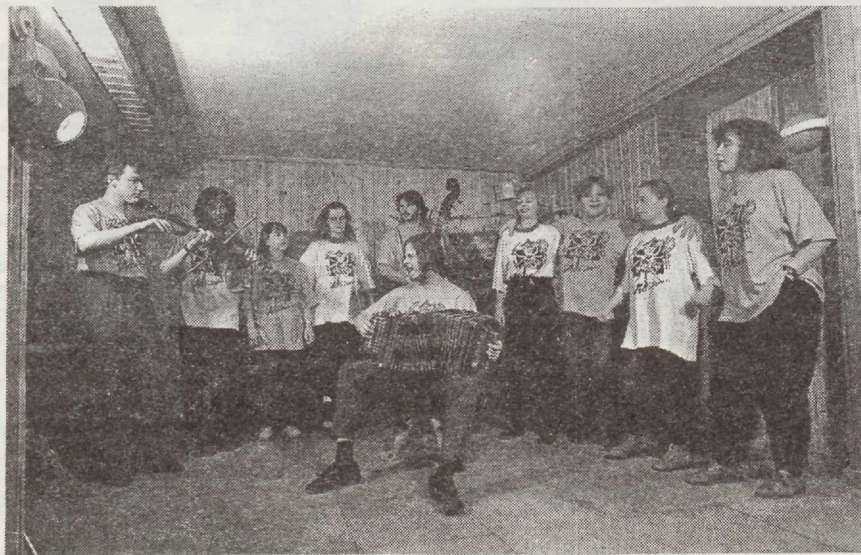
"Alle-aa" telesaates provintsielust 1991. a.

Milliseks kujuneb nende edaspidine tee, oleneb juba igauhest endast. Jääme lootma, et valitud tee on pärimusmuusika-sõbralik tee.