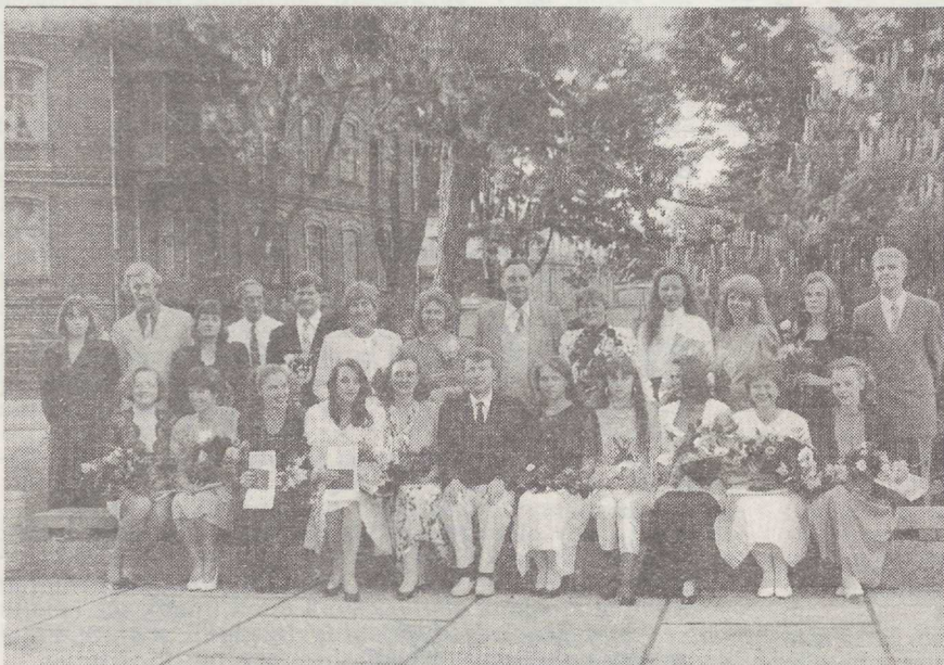
Humanitaargümnaasiumi muusikaosakonna esimese lennu lõpetajad ja õpetajad.