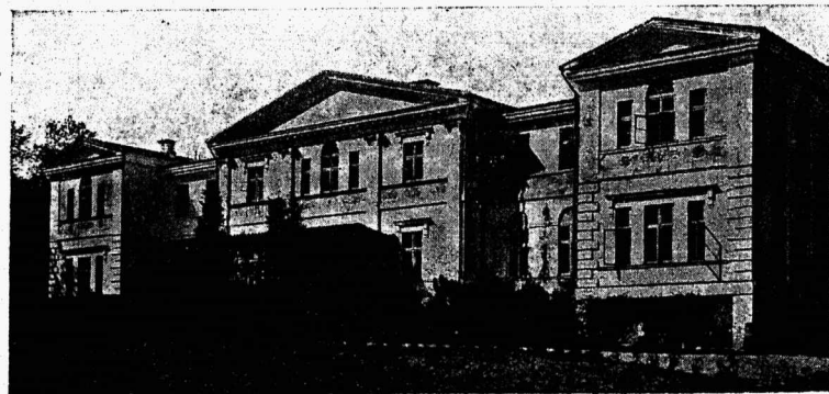
Kooli hoone ümberehitamisel 1935. a.