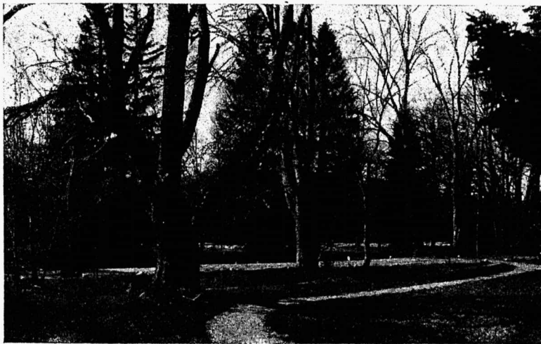
„Varjul Kuremaa järve veed, ees vaiksed pargiteed.“