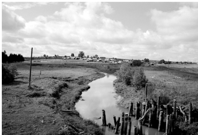
Joonis 2. Põhja-Udmurtia maastik.