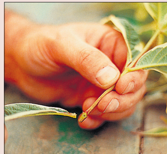
Eemaldage alumine lehepaar ja tehke lõige 5 mm sõlme alt.