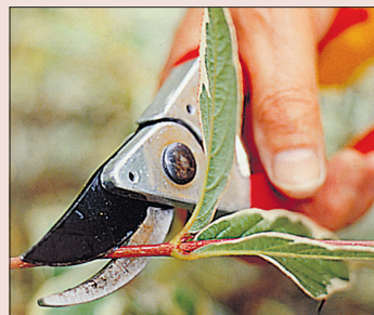
Lõigake kimp ladvavõrseid.