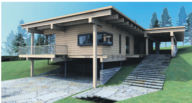
ARVUTIS loodud visioon Lohusalu majast hakkab üha enam sarnanema valmiva hoonega.