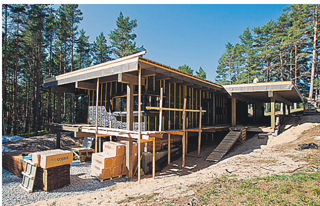
AVATÄITED paigas, saab asuda katusetööde juurde.