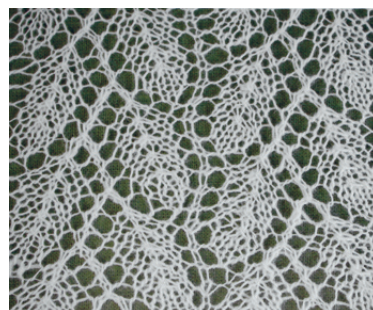
Pajulehekiri pitsilisena ...