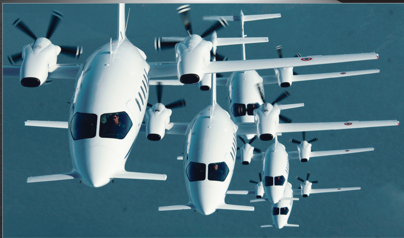
P 180 AVANTI II

95% lennuki kerest on valmistatud alumiiniumist. Salongi mahub pilootidele lisaks seitse reisijat.