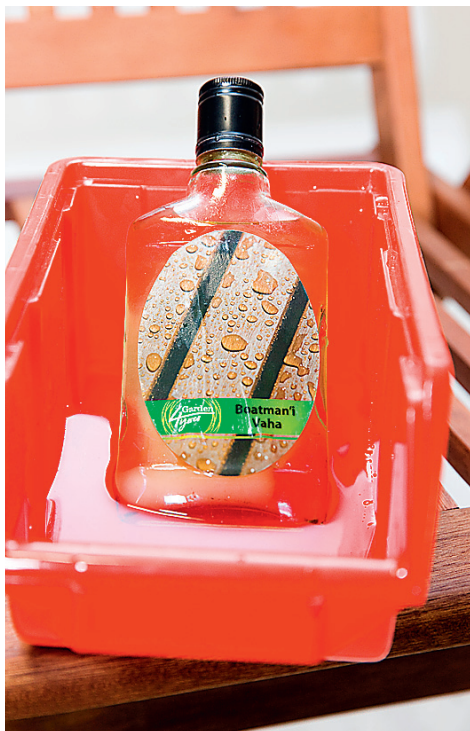
VAHA vees soojendamine enne õlitamist, soe vaha kuivab kiiremini kui külm.