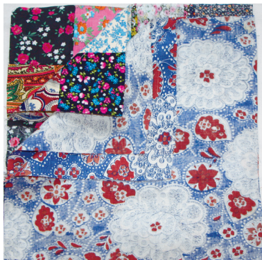
Foto 5. Lõigake voodriks kirjust sitsriidest kaks sama suurt tükki. Riiete ja voodri kokkupanek on vardakoti õmblemise juures kõige tähtsam osa. Pange lappidest õmmeldud (pealmistel tükidel) paremad pooled vastamisi ja voodririidel samuti paremad pooled vastamisi. Nüüd tõstke voodririided lappidest õmmeldud detailide peale. Traageldage koti neli detaili kolmest küljest kokku. Õmmelge masinaga need kolm külge kinni ning võtke traagelnii-did välja.