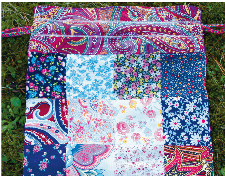
Foto 10. Õmmelge kanal, kuhu saab paela sisse ajada. Selleks tehke sirge õmblus ühest kanaliaugust teiseni, ülemisest otsast teise kanaliaugu ülemise otsani ning ühe kanaliaugu alumisest otsast teise alumise otsani. Paelakanali õmbluskohad on fotol märgitud valge kriidiga. Punuge meelepärane pael ning ajage see kanalisse. Paela punumisel arvestage koti kahekordne ümbermõõt ja veel umbes 20 cm. Paela ajage kanalisse kaks tiiru, nii jookseb kotisuu mõlemalt poolt tõmmates paremini kokku.

Foto 9. Nüüd pöörake pool suuriidest sissepoole, jälgides, et paela kanaliaugud on kohakuti. Pöörake teine serv umbes 1 cm ulatuses tagasi. Traageldage suuriie seestpoolt koti külge – nii saate jälgida, et õmblusvaru igalt poolt ühtlaselt sisse keerate. Seejärel õmmelge eelmise õmbluse pealt väljastpoolt umbes 1 mm kaugusel servast kinni. Nüüd õmmelge masinaga veel kord eelmisest õmblusest 0,5 cm kauguselt läbi. Samuti võib suuriide ülemise otsa servast läbi õmmelda.