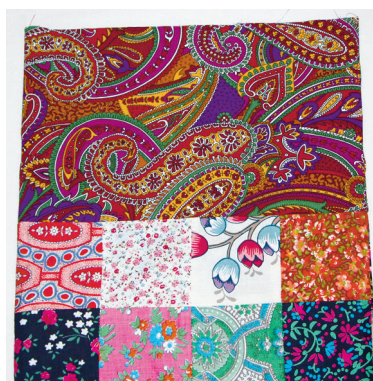
Foto 8. Asetage suuriide parem pool vastu koti paremat poolt nii, et servad on kohakuti ning kanali augud jäävad külgedele. Suuriide õmblemist alustage vardakoti ühelt küljelt. Esmalt traageldage ja seejärel õmmelge suuriie masinaga koti külge. Keerake suuriie üles ning triikige õmblus üle.

Foto 7. Vardakoti suuriideks võtke lappidega sobiv kirju sitsriie. Suuriide laiuse saate, kui mõõdate ära koti laiuse ja lisate 3–4 cm õmblusvarudeks. Suuriide kõrguseks arvestage 16–18 cm. Selliseid tükke lõigake kaks. Asetage suuriide tükid paremad pooled vastamisi. Õmmelge ülemisest servast 3 cm kinni, seejärel jätke 2 cm õmblemata, siis õmmelge 6 cm kokku, jätke 2 cm õmblemata ning lõpuks õmmelge ka viimased 3 cm kokku. Sarnaselt toimige ka teise küljega. Õmblemata kohtadest saavad kanaliaugud, mille kaudu hiljem paelad sisse aetakse, kokku neli kanaliauku. Triikige õmblused lahku ning õmmelge paela kanaliaugud paremalt poolt neljast küljest masinaga läbi, nii jääb see koht tugevam.