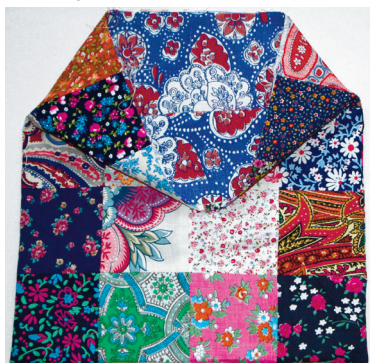
Foto 6. Keerake koti voodririided sisse ja pealmised riided välja.

Foto 5. Lõigake voodriks kirjust sitsriidest kaks sama suurt tükki. Riiete ja voodri kokkupanek on vardakoti õmblemise juures kõige tähtsam osa. Pange lappidest õmmeldud (pealmistel tükidel) paremad pooled vastamisi ja voodririidel samuti paremad pooled vastamisi. Nüüd tõstke voodririided lappidest õmmeldud detailide peale. Traageldage koti neli detaili kolmest küljest kokku. Õmmelge masinaga need kolm külge kinni ning võtke traagelnii-did välja.