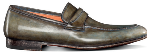
WILSON Penny shabby chic vasikanahast mokassiinid