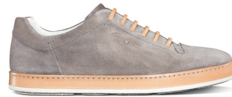
MONTREAL Ultrakerge kummist tallaga seemisnahksed tennisid