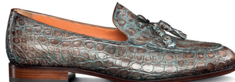
SANTIAGO Kahekihiliselt värvitud krokodillinahast kingad lipsukesega