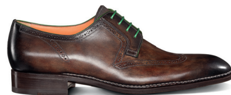
DERBY Kontrastses toonis nõõridega vasikanahast kingad