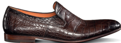
WILSON Kätsiti lakitud pehmed krokodillinahast mokassiinid

kokku murda) ka krokodillinahast topeldatud purjetechnikaga kingi, mille aluskihile lisatakse teine kiht värvi pintsliga soomuste vahele.