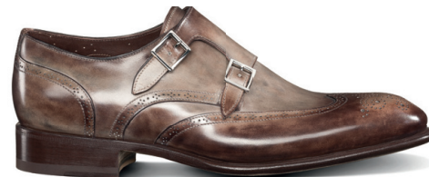
CARTER Ümara ninaga kätsiti värvitud vasikanahast kingad