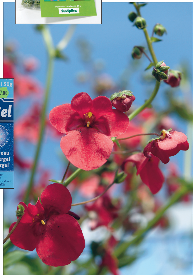
Harilikku kaksikkannuse ( Diastoma barberae ) tumeroosa sort 'Diastoma'.

TARGU TALITA ilmub koos Maalehega. Lehekülgede numeratsioon algab 4. jaanuarist 2008