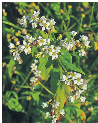
Tatar (ülal) ja keerispea (vasakul) on ilusad pinnakatjad ja head meetaimed.

Ja veel üks tore võimalus – rukis. Tema sügav juur kobestab maad hästi, sügisel mulla sisse hakitud