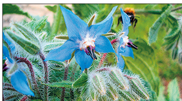
Suurema lapina kasvav kurgirohi tekitab aeda ilusa sinise värvilaigu ja on paksult mesilasi täis.