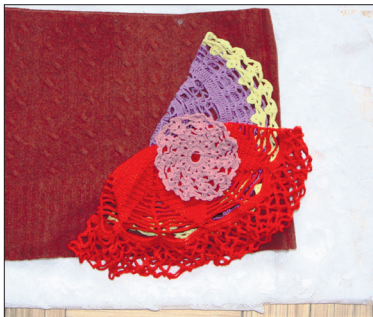
Lõigake kampsunil varrukad ja ülemine osa ära.