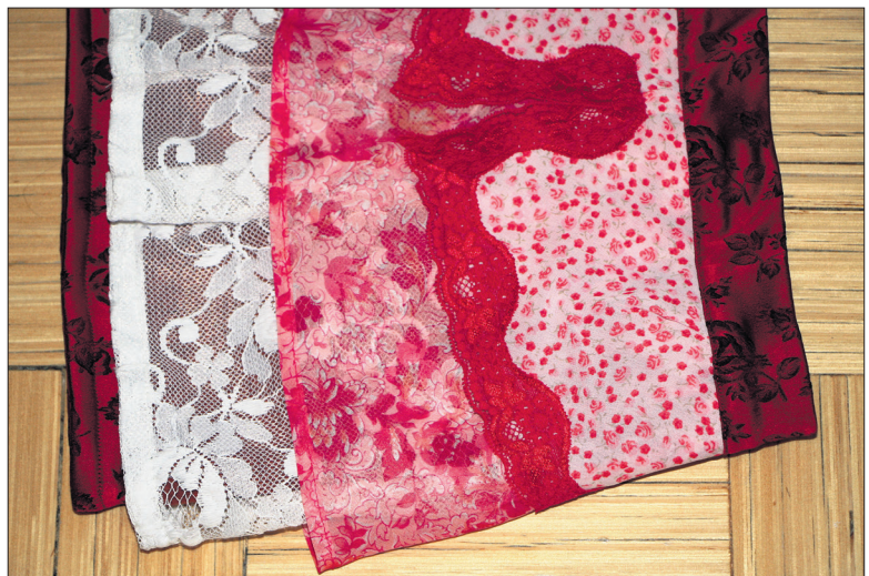
Seeliku aluminegi serv on kanditud punase lillelise atlasskangaga.