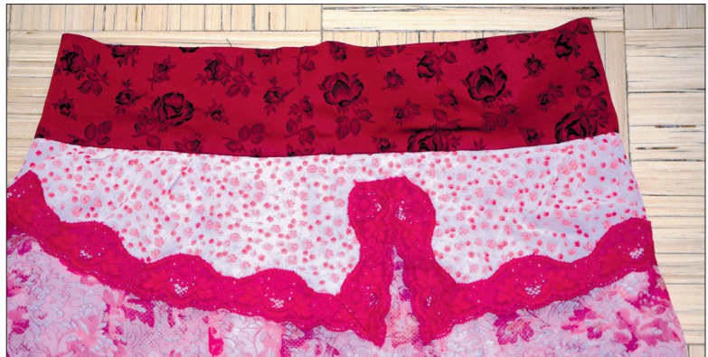
Ülemine kant on õmmeldud punasest lillelisest atlasest. Jätke pahemal poolel kandi alumisse serva ka väike ava, mille kaudu saate kummi sisse ajada.

Vanutatud kampsun jätke kõige alumiseks kihiks, selle ümber hakake sättima teisi kangaid. Valge osa on lõigatud vanast kardinast, roosad kihid on pärit väikseks jäänud suveseelikust. Õmmelge kangad ülevaalt kinni, nii püsivad kihid kandi õmblemise ajal paigas ja ei libise välja.