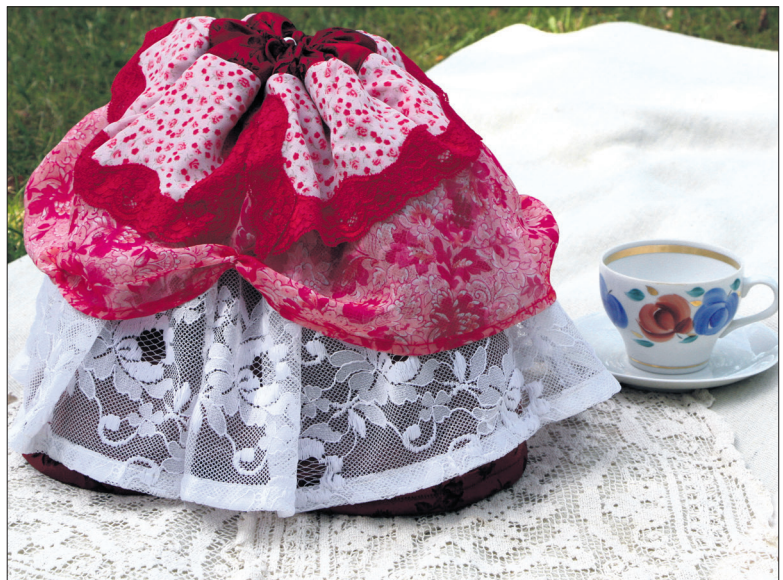
Elegantne printsessiseelik hoiab kohvi sooja ja annab mahti perenaisel ka külalistega suhelda.