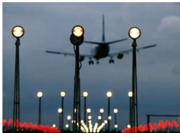
Lennundus on üheks kiiremini kasvavaks saaste- ja süsinikdioksiidi heidete allikaks

Kliimamuutuste mõjude majanduslikud kulud (st tegevusetuse kulud) aitavad üha enam teavitada poliitikadebatti. See on hädavajalik adekvaatsete kohanemisreaktsioonide väljatöötamiseks kliimamuutustega seotud kahjude leevendamise või võimaluste realiseerimise vahendina. Majanduslikud kulud on ühtseks mõõdukaks hindamisel ja monitoorimisel sektorite lõikes ning võivad aidata tuvastada peamisi problemaatilisi valdkondi. Samuti on vajadus majandusliku perspektiivi järele Euroopa ja liikmesriikide kohanemispoliitikates, et täiendada meie kliimamuutuste mõjude alaseid teadmisi. Kohanemiskulude kohta on tõepoolest saadaval väga vähe kvantifitseeritud teavet