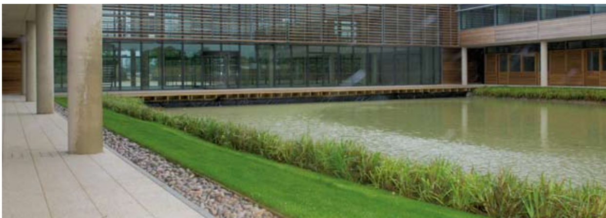
Innovatsiooni ja ettevõtluse baas Lutonis.

SmartLIFE ( Smart Lifestyle Innovations for our Environment , targad elustiili uuendused meie keskkonnale) oli rahvusvaheline pilootprojekt, mida juhatas Cambridgeshire maavolikogu partnerluses Malmö linna keskkonnaosakonnaga Rootsist ja TuTech Innovation GmbH-ga Hamburgist Saksamaalt. SmartLIFE'i peamiseks fookuseks oli ehitustööstuse oskuste ja jõudluse puudujäägid uute elamute tootmisel, mis oleks nii taskukohased kui ka keskkonnasäästlikud. Projektiga seati sisse terve hulk koolituskursusi ja kvalifikatsioone. SmartLIFE'iga püstitatud keskustest on läbi käinud ligi 2500 praktikanti. Projekt sai mitmeid keskkonnaalaseid auhindu ning on valitud DG Regiostars Awards 2008 auhinna saajaks.