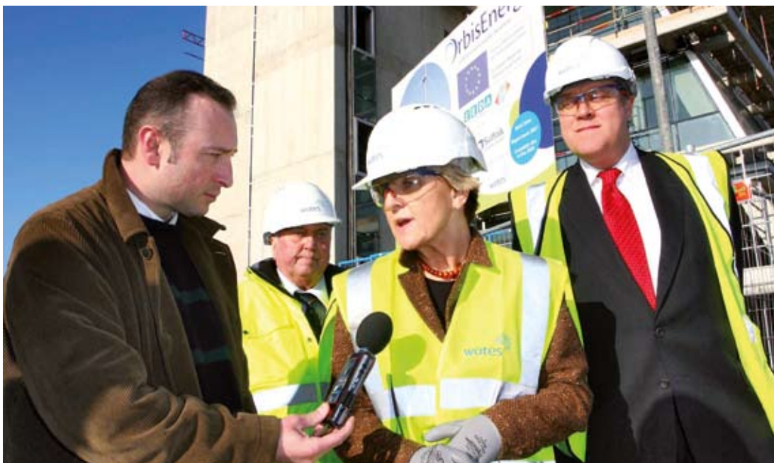
Volinik Danuta Hübner külastamas OrbisEnergy ehitusplatsi jaanuaris 2008.

Ida-Inglismaa on üks väheseid Euroopa piirkondi, mis tõenäoliselt saavutab uued ja ambitsioonikad ELi süsinikdioksiidi vähendamise eesmärgid, mille Euroopa Komisjon püstitas oma hiljutises ettepanekute paketi kliimamuutustega võitlemiseks ja taastuvenergia edendamiseks. Samuti on tegemist ainsa piirkonnaga, millel on 110 miljoni eurone spetsiaalselt kujundatud ERFi süsinikdioksiidi heidete vähendamise programm, mis aitab vähendada süsinikdioksiidi heiteid ja hoogustada majanduskasvu.