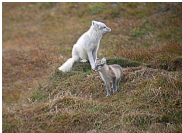
Polaarrebese karvastiku värvi on kliimamuutused juba mõjutanud.

liustike ja igikeltsa sulamine põhjustab tõenäoliselt looduslike riskitegurite, pinnase erosiooni ja üleujutuste buumi. Austria tegeleb juba nimetatud riskide ja seonduvate kahjulike mõjude hindamisega talitursismi osas, oma haavatavuse hindamisega kliimamuutuste mõjule ning võimalike meetmete koostamisega õigeaegseks kohanemiseks, et vähendada sotsiaalseid kulusid. Kliimamuutustel võib olla suur mõju rannikualadele, tingituna merepinna tõusmisest ning muutustest tormide sageduses ja/või intensiivsuses. Koostöös erinevatest sektoritest pärit sidusrühmadega on Madalmaad välja töötamas plaane rannikuäärsete ja jõgede üleujutuste riskide vähendamiseks. Märgalade märkimisväärse kadumise tõttu on eriti suures ohus Läänemere, Vahemere ja Musta mere ääres asuvad elupaigad ja rannikuäärsed ökosüsteemid. Eurooplastel on seetõttu hädavajalik seda tunnistada ning panna paika õigeaegsed, adekvaatsed ja tasuvad kohanemismeetmed, et vältida või vähendada nimetatud sündmuste võimalikku kahju inimestele ja ökosüsteemidele. Haavatavuse vähendamine ja ilmastikukindluse