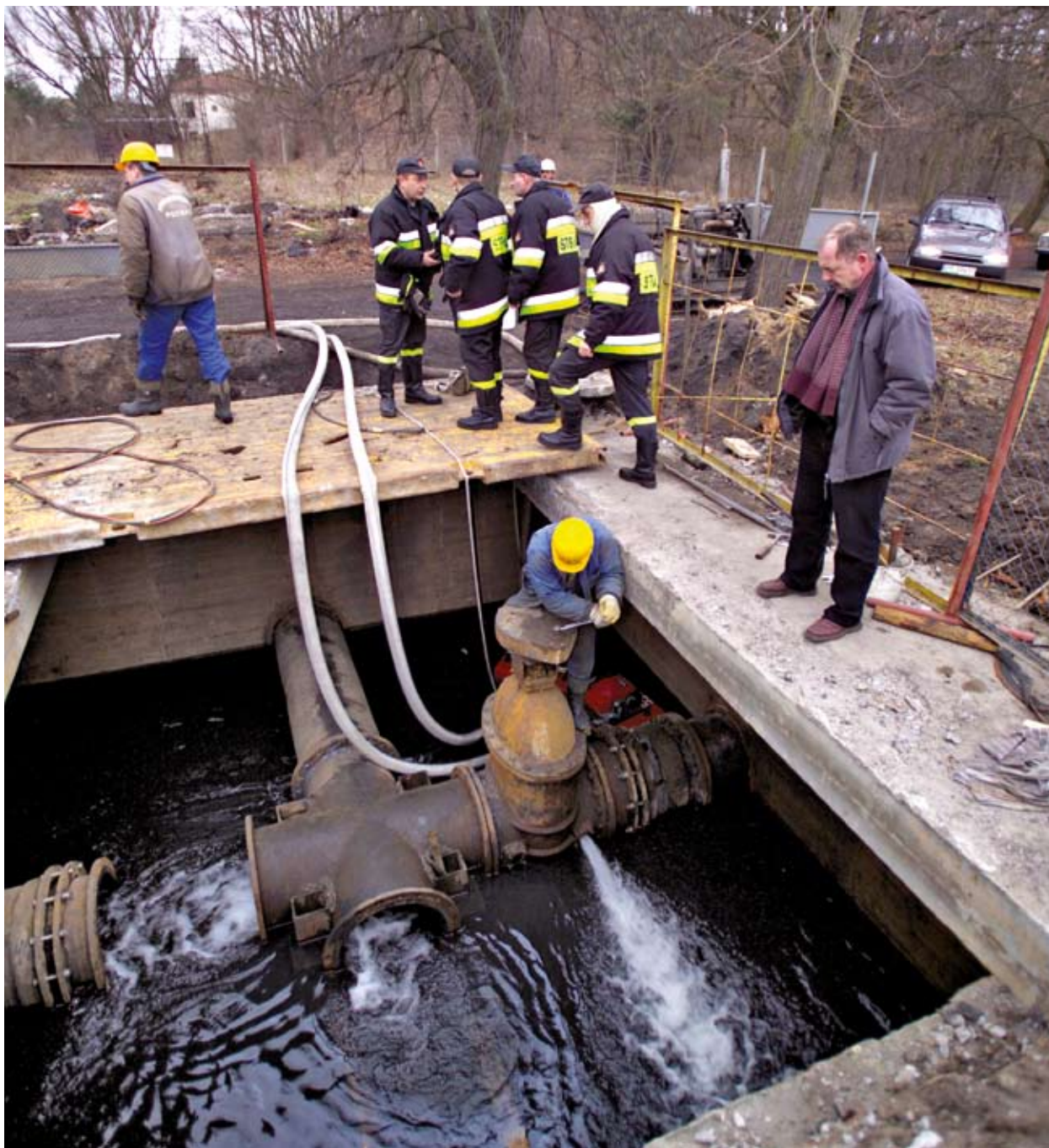
Süvakaevupumpade paigaldamine uues veefiltreerimistehases Poolas Dodrzcycas.

ka siseriiklike strateegiaid ja poliitikaid seoses keskkonnakaitsega Poolas. Rakenduskava elluviimise kaudu toimub mõningane edasimineku „lahutamispõhimõtte“ täitmises, st heitetasemete või energianõudluse sõltuvuse eraldamine majanduslikust arengust.