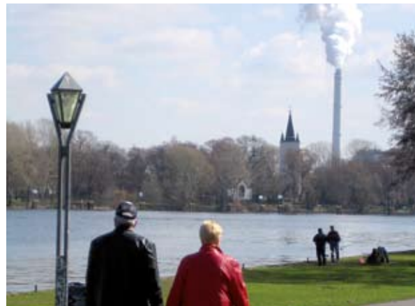
Kohanemismeetmete väljatöötamine ja rakendamine on suhteliselt uus teema.

Kohanemismeetmete väljatöötamine ja rakendamine on suhteliselt uus teema. Kliimamuutuste laiaulatuslikke