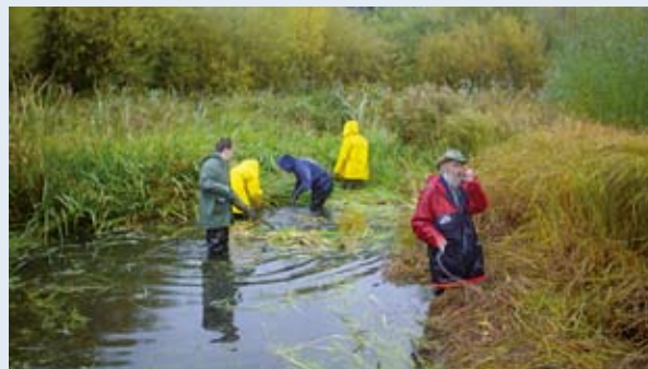
Ökosüsteemidest hoolimine on kõigi ühine mure.

Ühtekuuluvusfondi määruse artiklis 1 korratakse, et fond loodi sooviga tugevdada majanduslikku ja sotsiaalset ühtekuuluvust, pidades silmas säästvat arengut, samas kui artiklis 2 rõhutatakse fondi uut keskendumist säästvatele arengule, kuulutades energiatõhususe ja taastuvate energiaallikate abikõlblikkust.