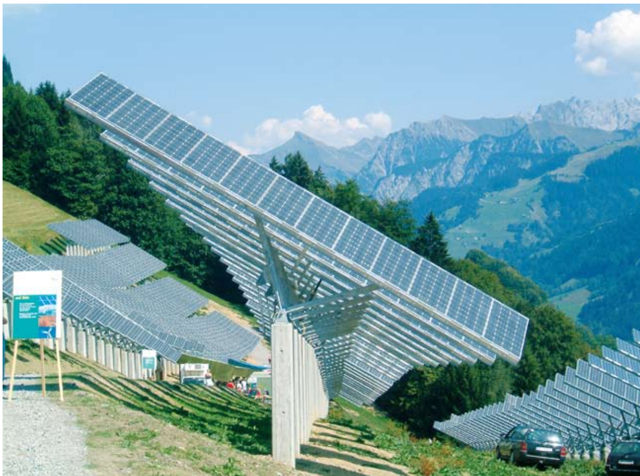
■ Suur fotovoltüsteem toodab 530 MWh päikeseenergiast Austrias Blonsis.

Kliimamuutused – ning nende mõju meie tootmisele ja tarbimisele – on üha enam säästva arengu poliitika keskmes. Piirkondlikus arengus on need seetõttu kesksel kohal, esitades pretseedenditu väljakutse, kuid samuti ka võimaluse Euroopa piirkondadele seoses nende suutlikkusega uuendusteks ja uute töökohtade loomiseks.