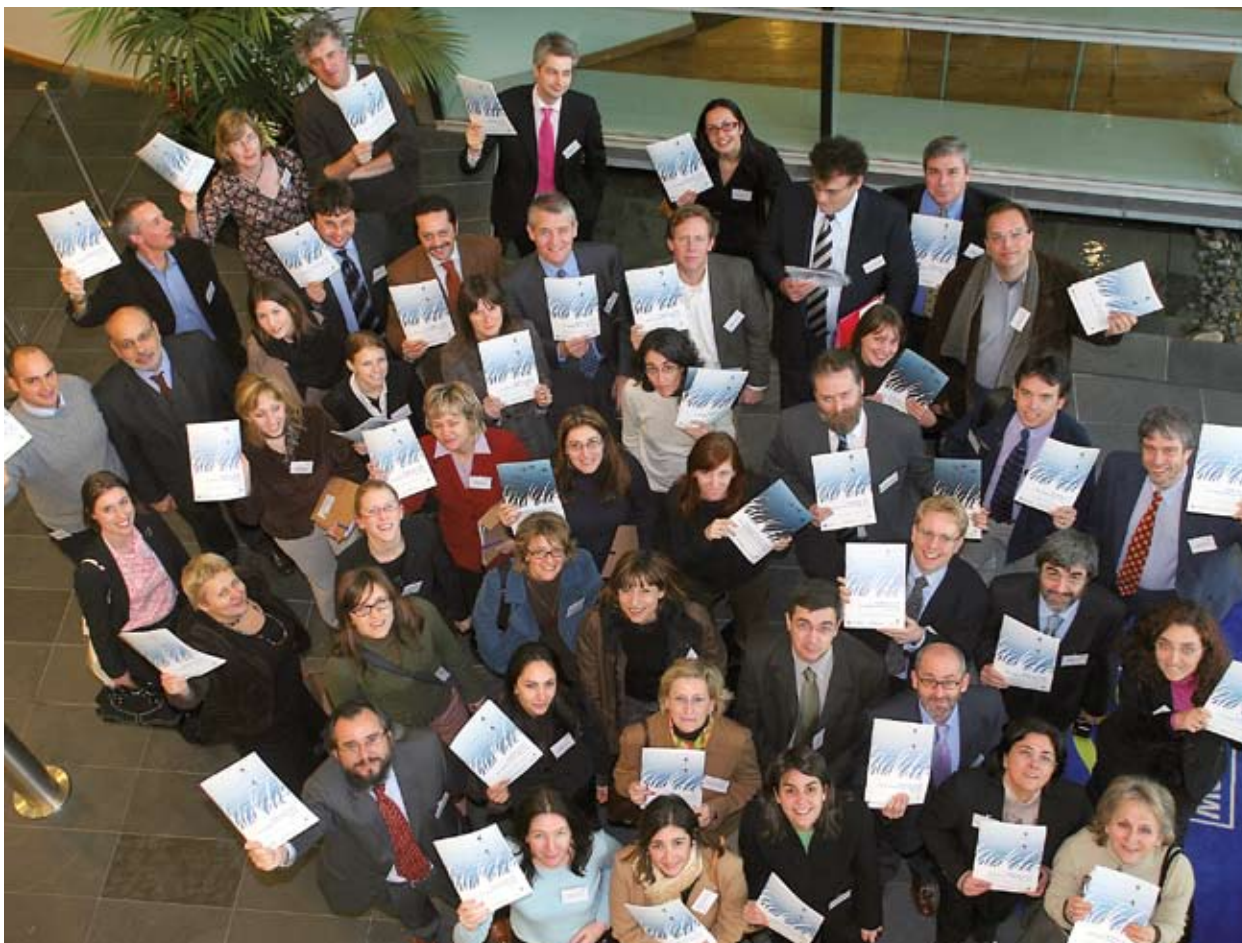
Seminaril osalejad Inglismaal Exeteris aastal 2006.

Võrgustikuga Greening Regional Development Programmes (GRDP) töötati välja tooted, mis aitaksid avalikel asutustel asetada kohaliku ja piirkondliku arengu vallas põhirõhu keskkonnaküsimustele.