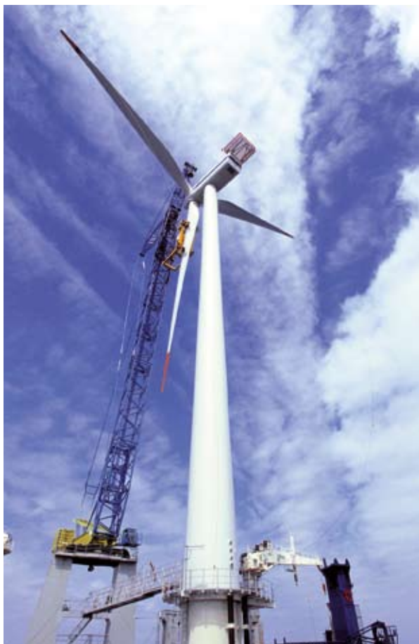
Avamere tuuleturbiini püstitamine.

avamere tuuleparke Ühendkuningriigis. Scroby Sands toodab piisavalt energiat, et varustada üle 36 000 kodu, säästes üle 65 000 tonni süsinikdioksiidi heiteid.